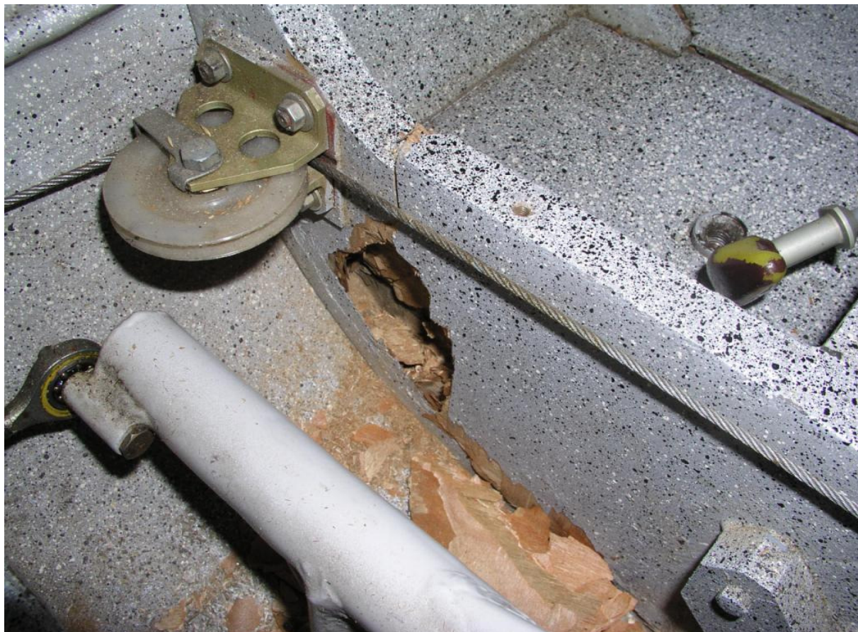
6 – Uszkodzenie wręgi po lewej stronie – widać wyłamanie wręgi ze struktury.