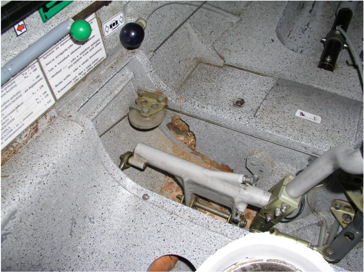
4 – Wnętrze kabiny po zdjęciu osłon sterowania, lewa strona – widoczne uszkodzenie wręgi.