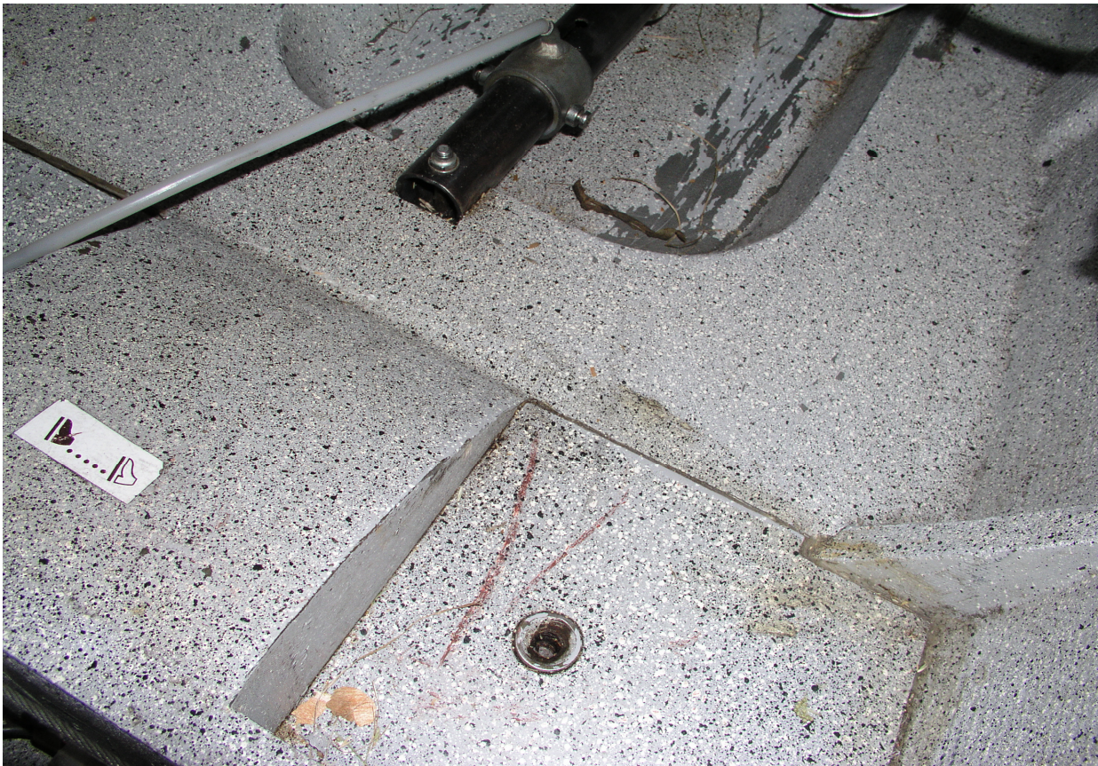
5 – Wnętrze kabiny po zdjęciu osłon sterowania, prawa strona.