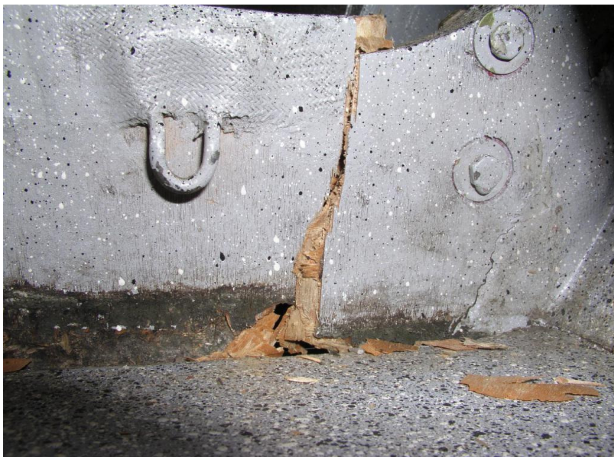
7 – Uszkodzenie wręgi po prawej stronie – widać wyłamanie wręgi ze struktury.