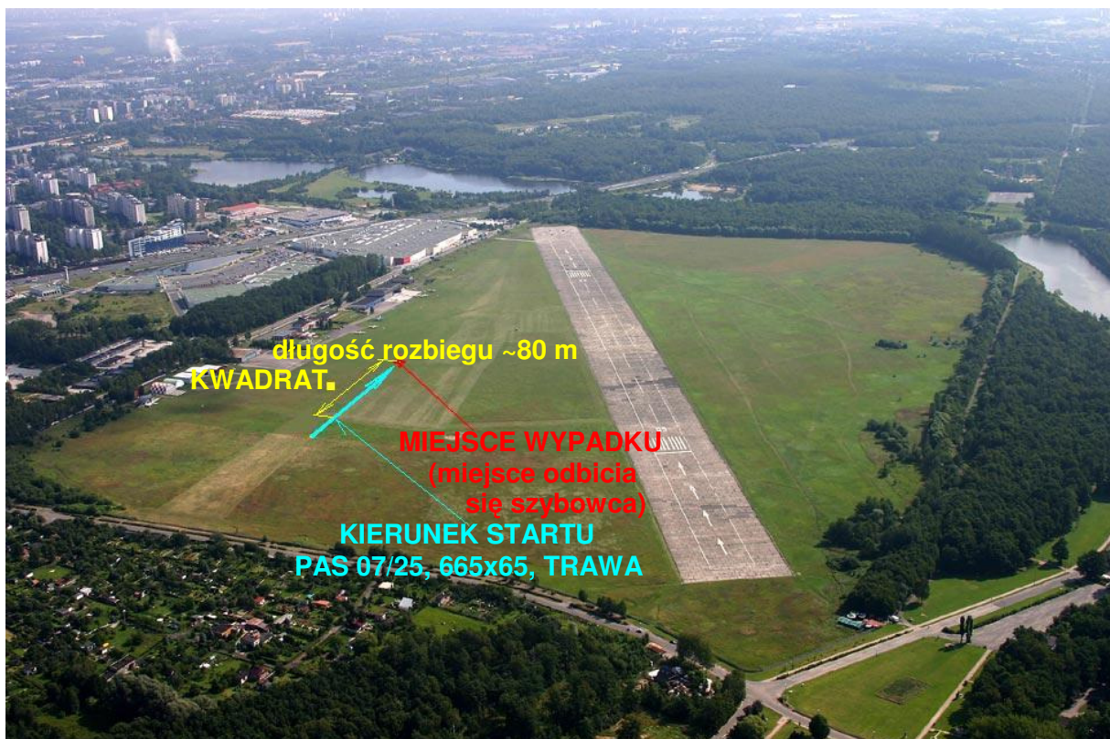
2 – Miejsce wypadku, zaznaczone na zdjęciu lotniczym lotniska Katowice-Muchowiec.