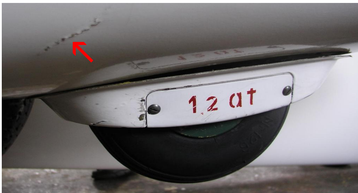
3 – Pęknięcie pokrycia po prawej stronie w okolicy zamocowania kółka przedniego.