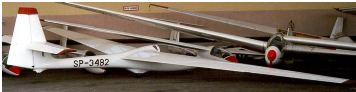
1 – Szybowiec SZD-50-3 Puchacz SP-3482 przed wypadkiem.