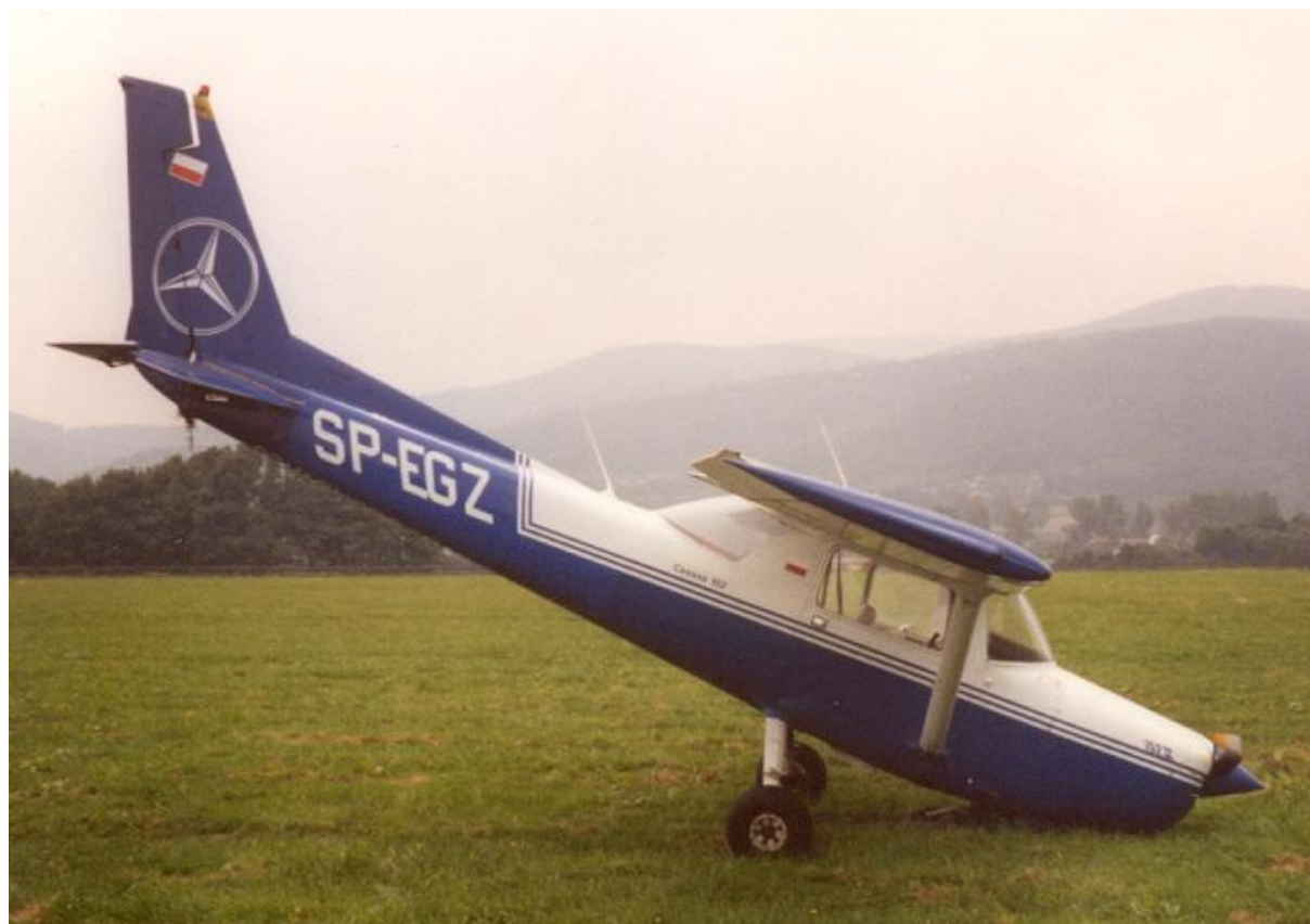
5 – Ogólny widok samolotu po wypadku, prawa strona. Widoczna uszkodzona łopata śmigła.