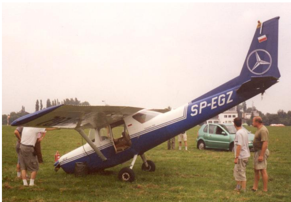
6 – Ogólny widok samolotu po wypadku, lewa strona.