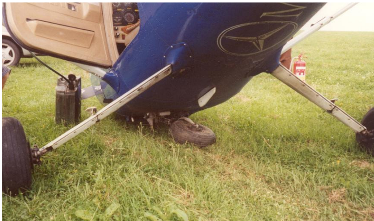
7 – Uszkodzenia płatowca – widoczne złamane podwozie przednie.