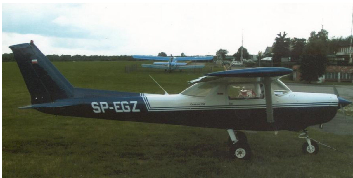
3 – Samolot Cessna 150 SP-EGZ sfotografowany przed wypadkiem.