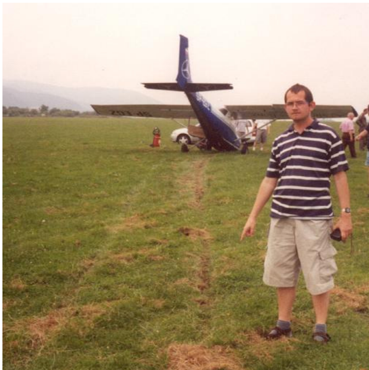
4 – Samolot po wypadku na lotnisku, widoczne ślady podwozia na trawie.