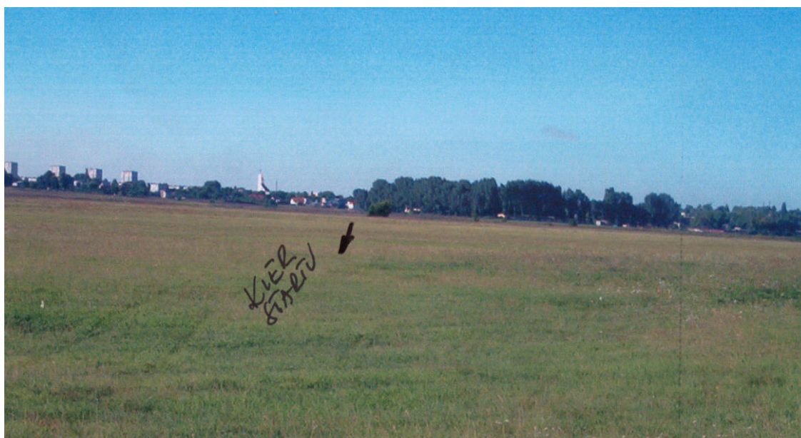
Fot.3 – Kierunek startu rzeczywistego.