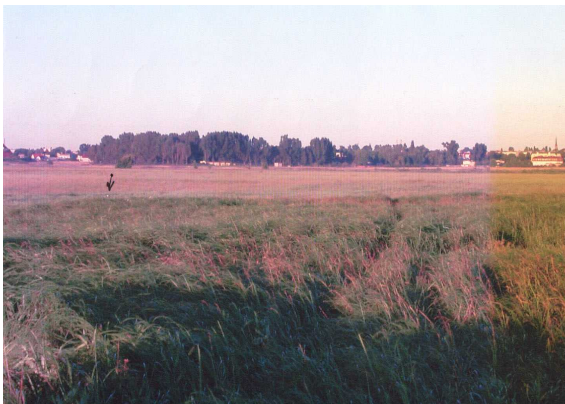
Fot.4 – Ślady w miejscu wypadku.