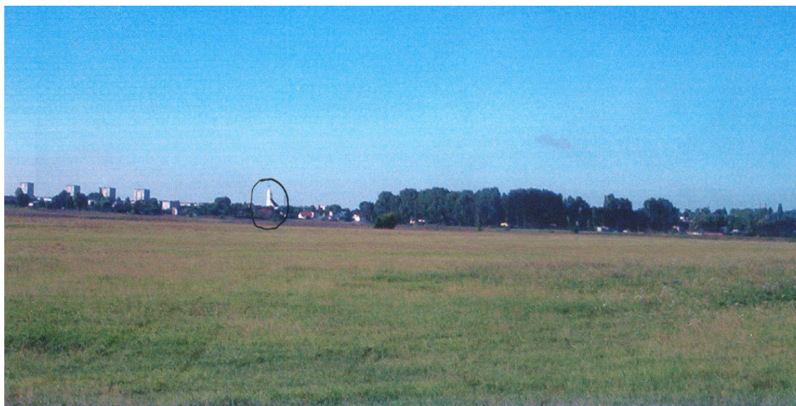
Fot.2 – Kierunek startu wyłożonego.