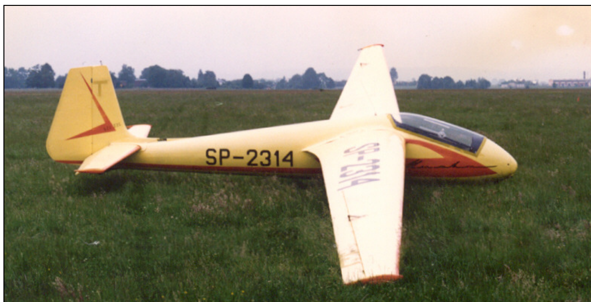
1 – Szybowiec przed wypadkiem.