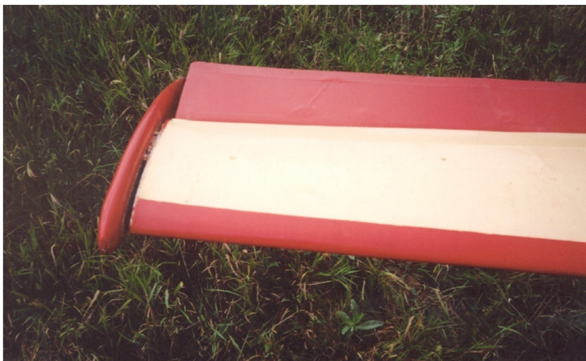
2 – Uszkodzona końcówka prawego skrzydła – odklejony klocek ochronny.