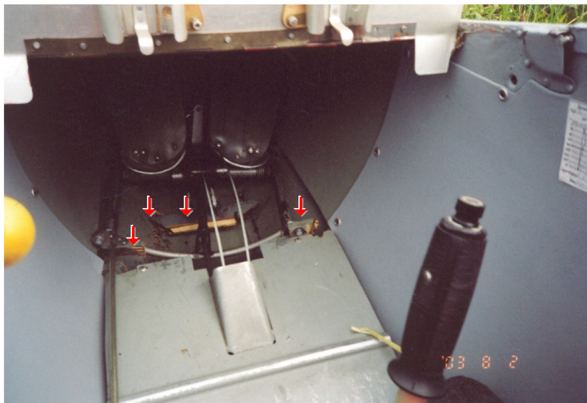
4 – Widoczne uszkodzenia wewnątrz kabiny szybowca – pęknięcia, odklejenia i wyłamania elementów przy podłodze.