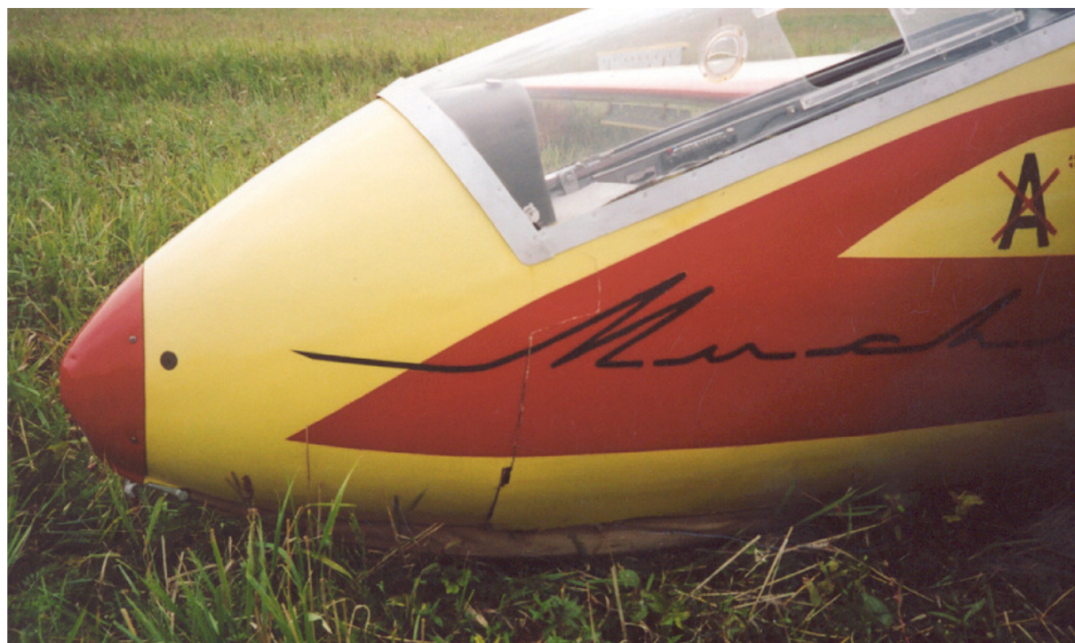
3 – Uszkodzenia przedniej części kadłuba szybowca – pęknięcie pokrycia na wrędze i przy płozie.