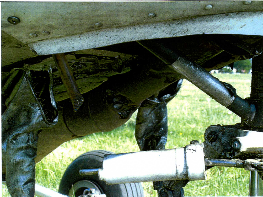
Foto 7 Uszkodzony tłumik drgań