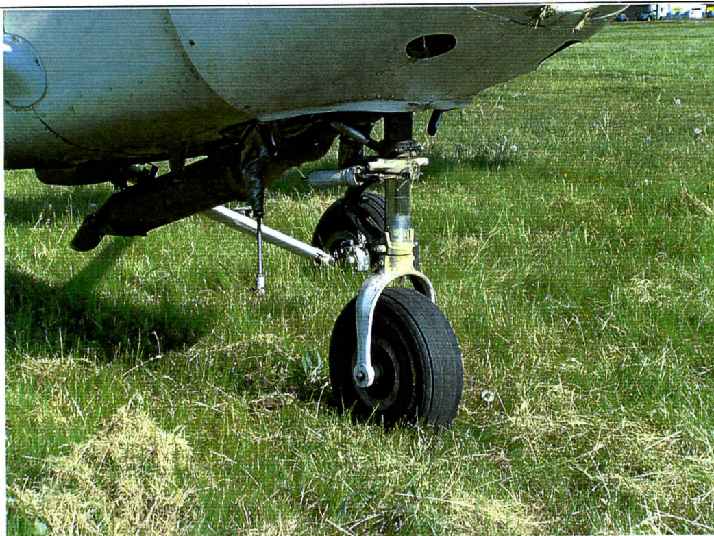
Foto 3. Widok przedniej goleni