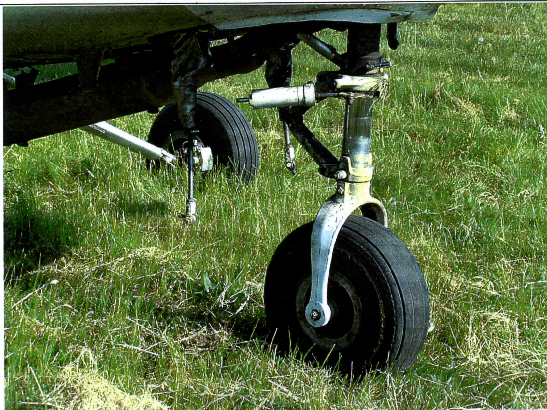
Foto 5 Widok uszkodzonej przedniego podwozia