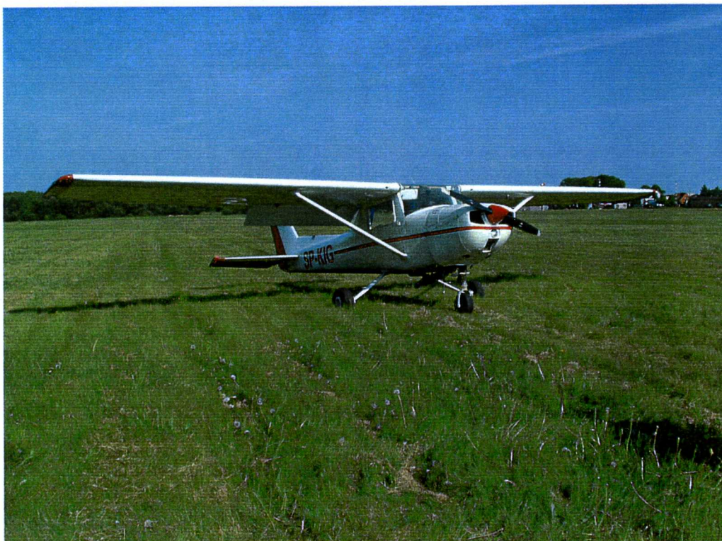
Foto 1 Widok samolotu SP-KIG