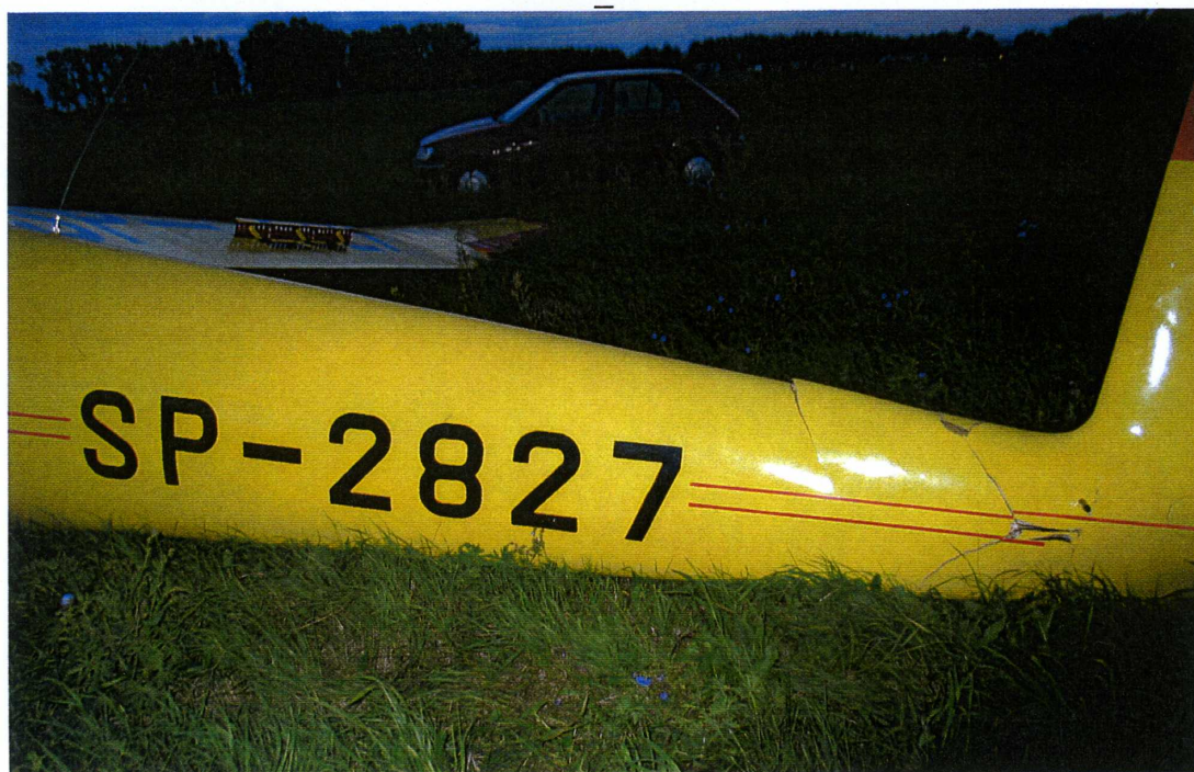
Foto 7 Widok pęknięć z lewej strony