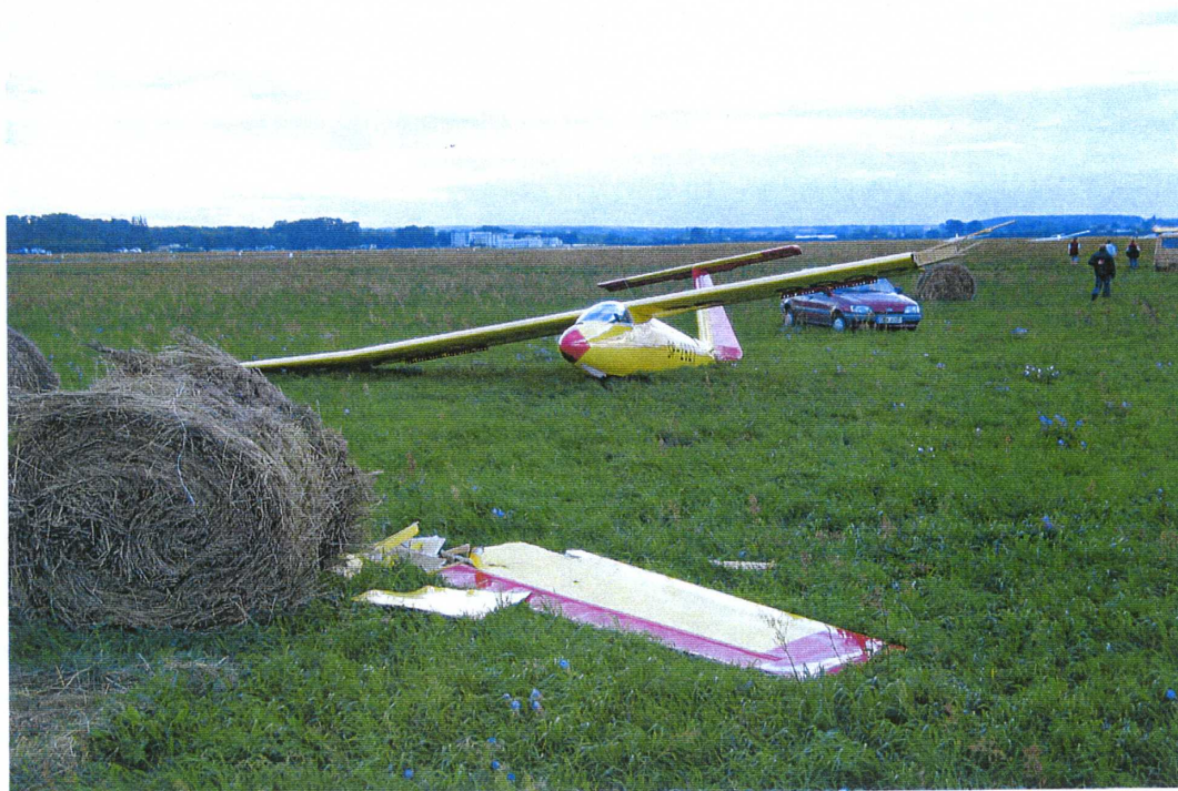
Foto 4 Widok miejsca wypadku