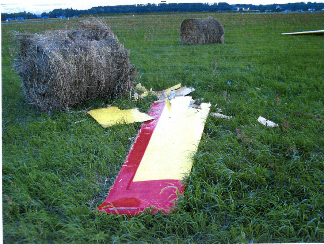
Foto 3 Urwane lewe skrzydło szybowca