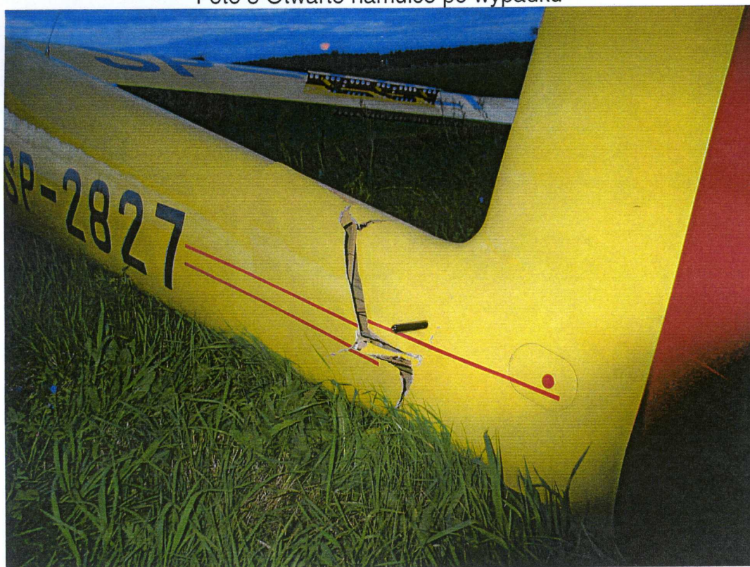
Foto 6 Pęknięcie kadłuba przed statecznikiem pionowym