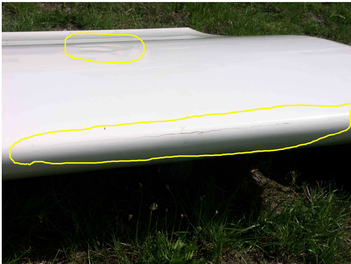
Fot.6 – Lewe skrzydło szybowca Junior SP-3461 – widoczne wgniecenie w rej. dźwigara i pęknięcie pokrycia noska.