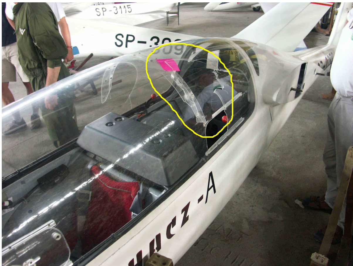
Fot.1 – Uszkodzone oszklenie kabiny szybowca Puchacz SP-3358 (widoczne naprawione wcześniejsze pęknięcia).