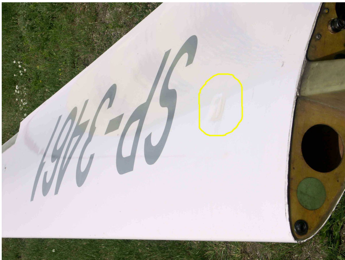
Fot.3 – Lewe skrzydło szybowca Junior SP-3461 – widoczne wgniecenie w rejonie dźwigara.