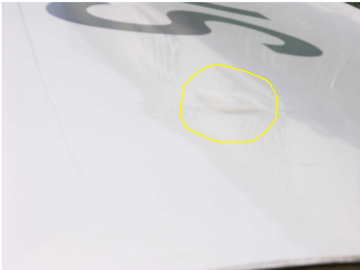
Fot.4 – Lewe skrzydło szybowca Junior SP-3461 – widoczne wgniecenie w rejonie dźwigara.