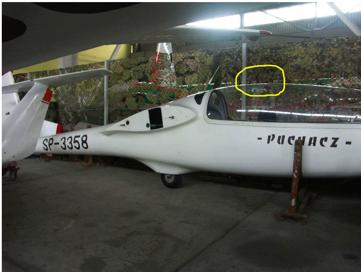
Fot.2 – Kadłub zdemontowanego szybowca Puchacz SP-3358.