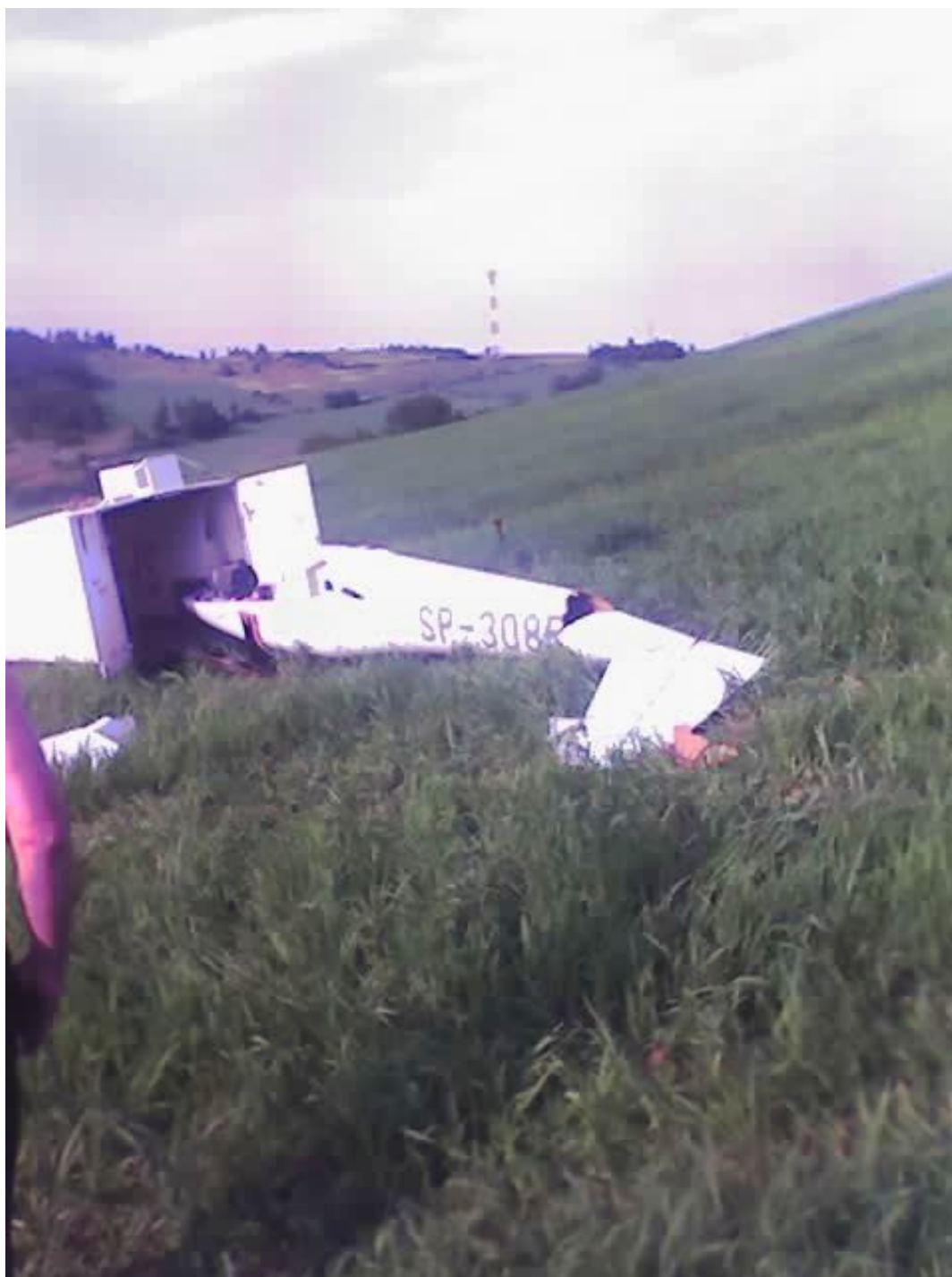
Foto 3 Kadłub przed załadunkiem do przyczepy – widoczny kąt nachylenia zbocza wynoszący ok. 15°