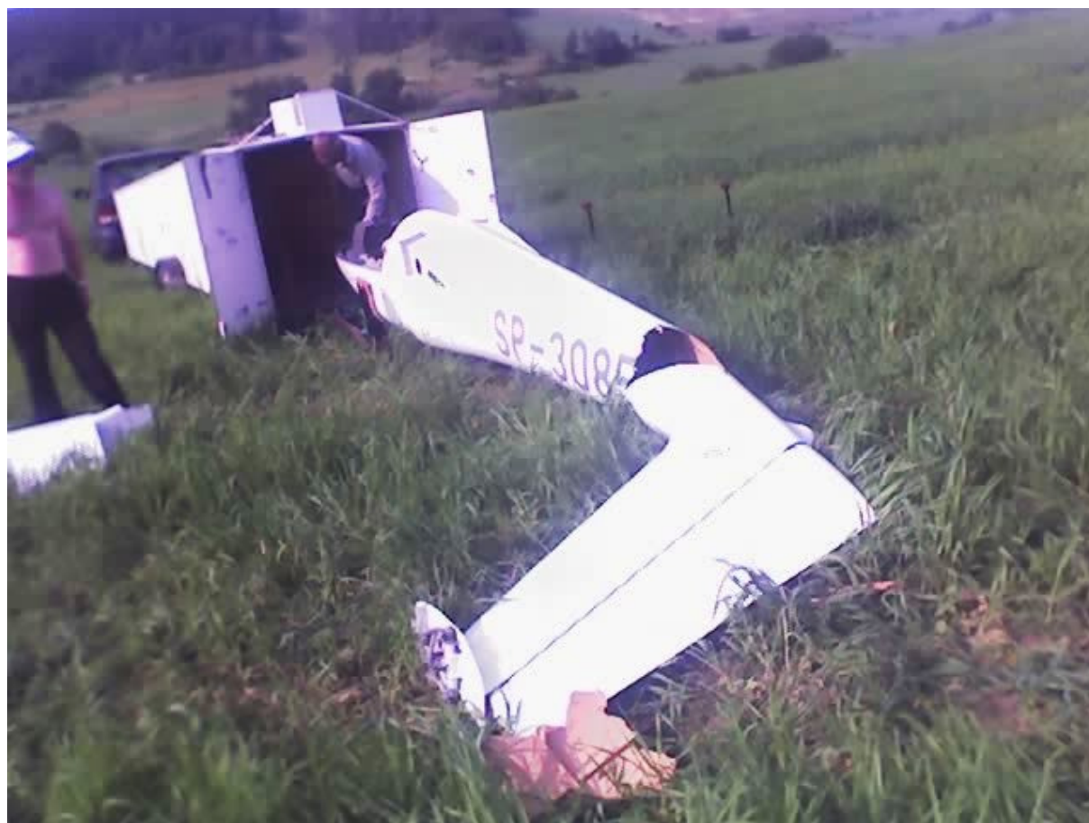
Foto 4 Widok na ukłębony ogon