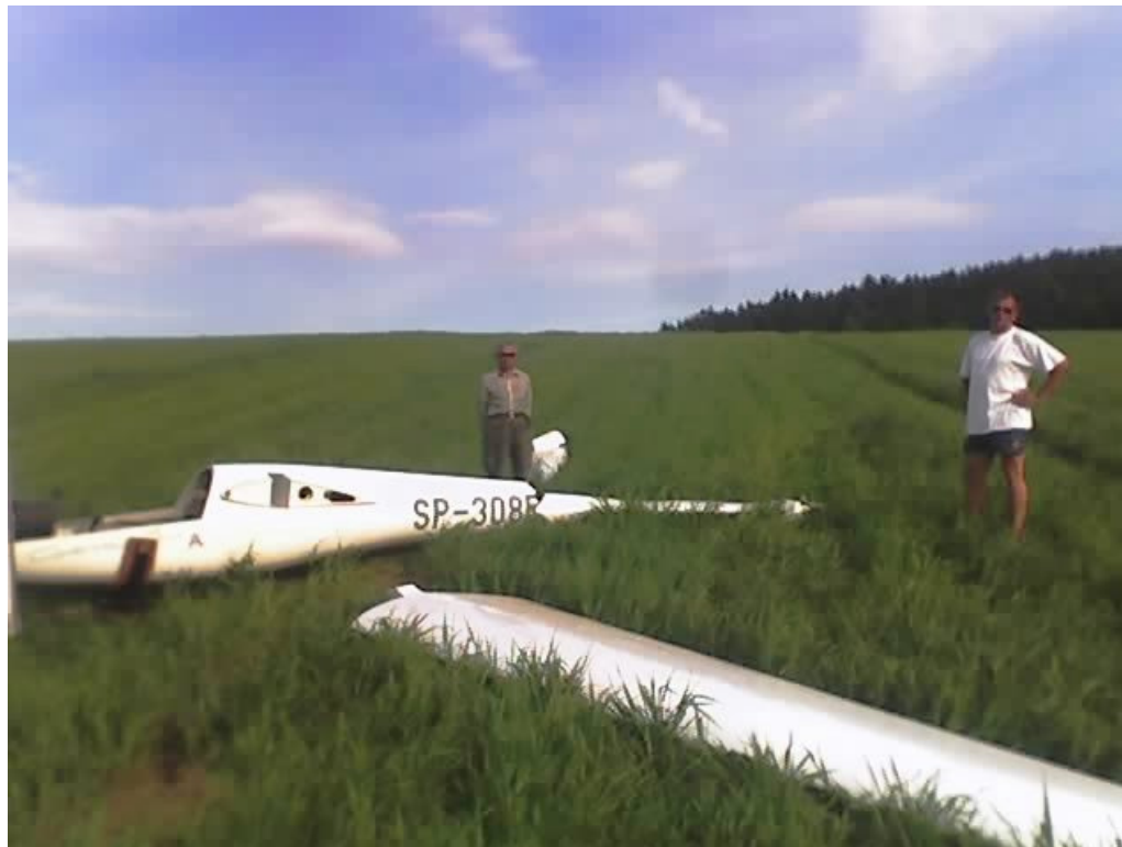
Foto 2 Szybowiec z zdemontowanymi skrzydłami i usterzeniem - przygotowany do załadunku do przyczepy.