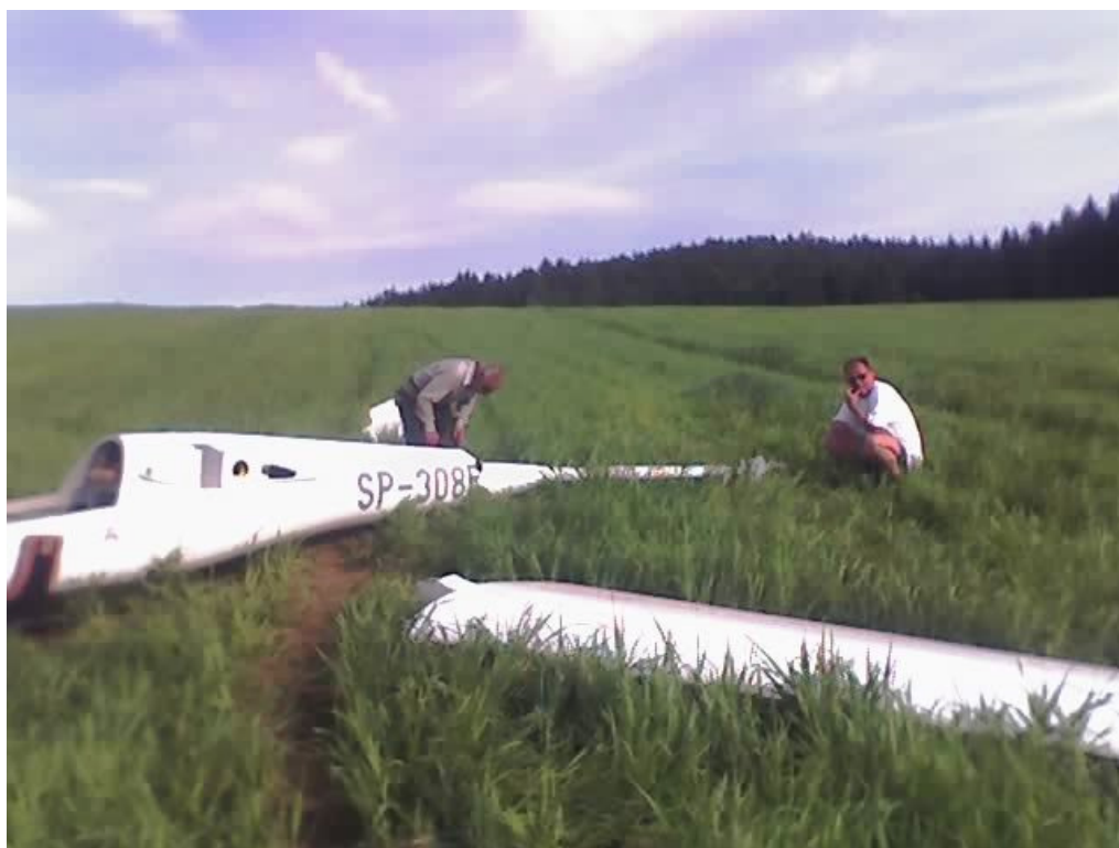
Foto 1 Widok z kierunku podejścia do lądowania