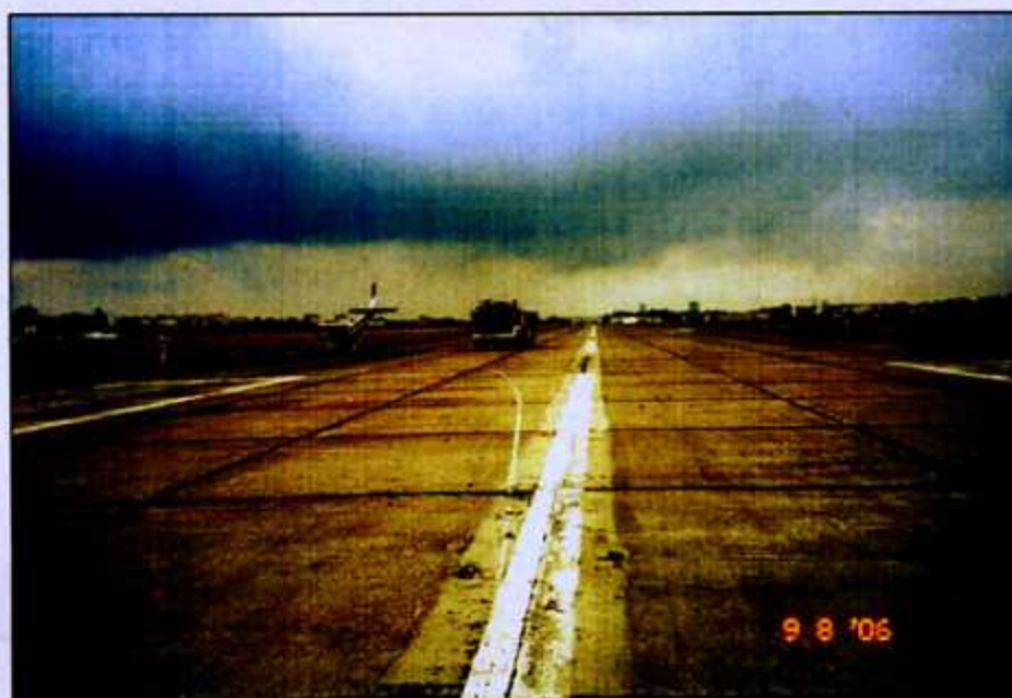
Rys. 3. Widok ogólny miejsca zdarzenia