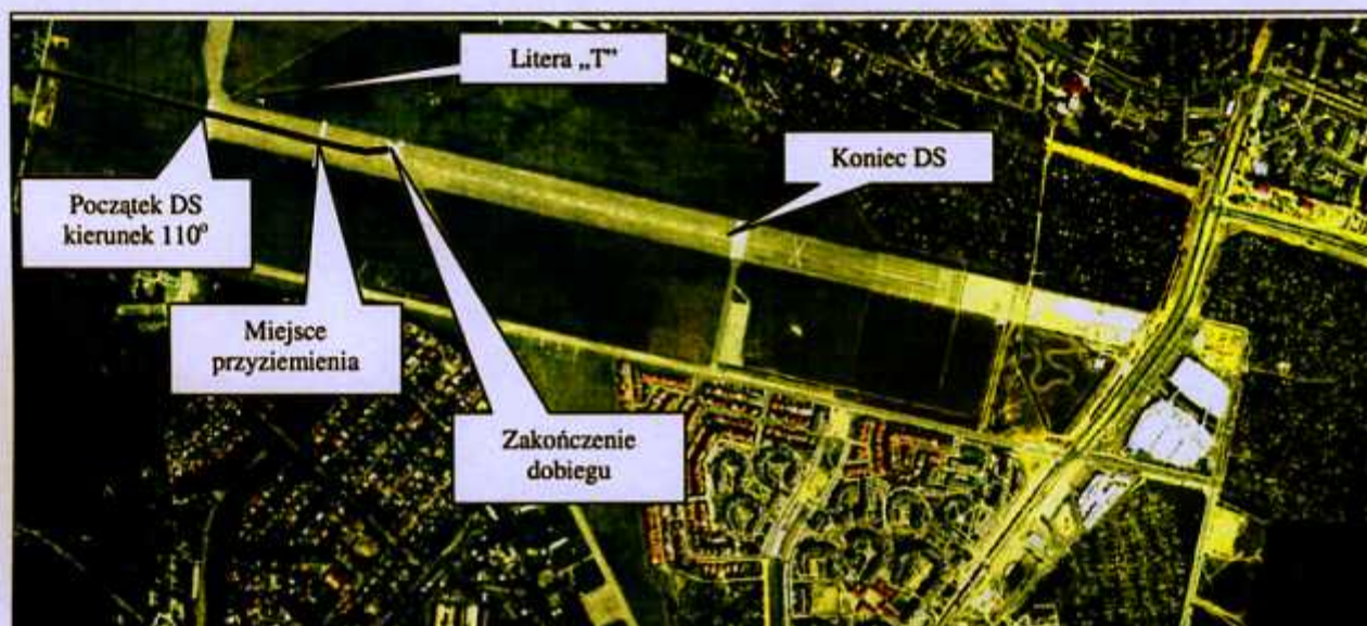
Fot. 2. Rejon wypadku na zdjęciu satelitarnym