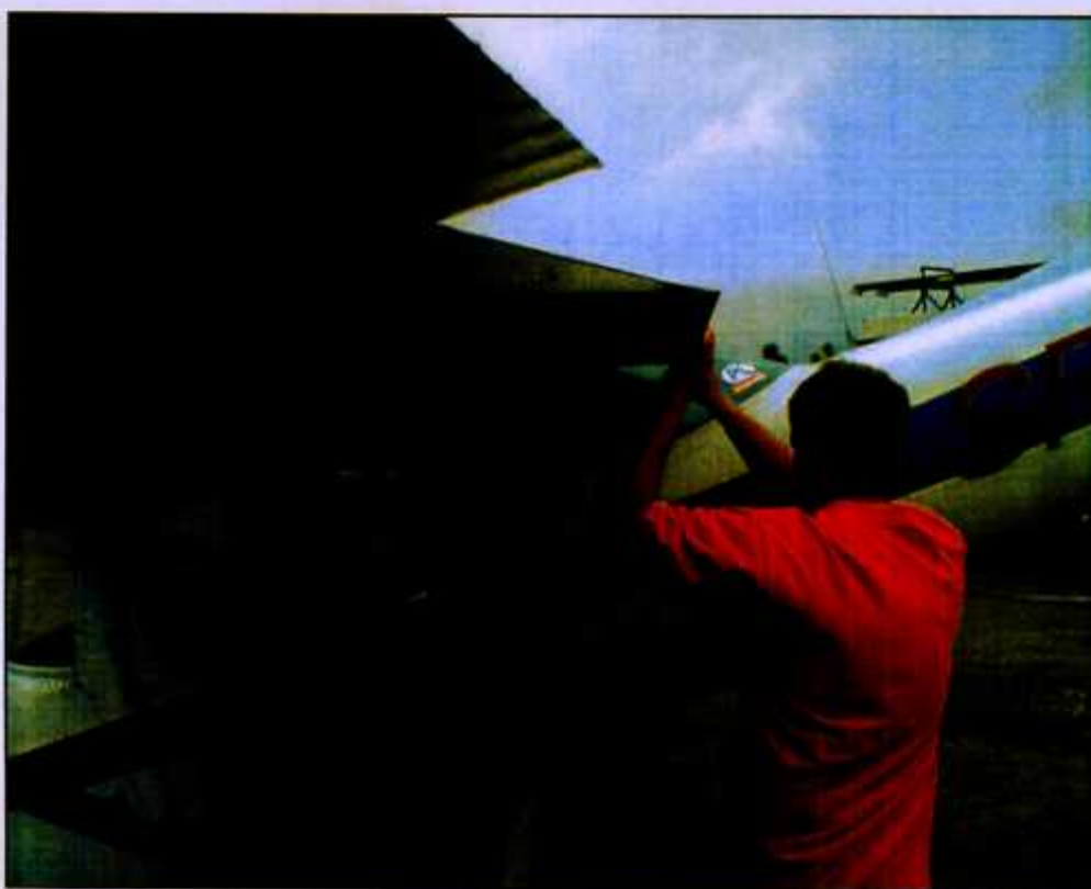
Fot. 8. Położenie klap samolotu po wylądowaniu