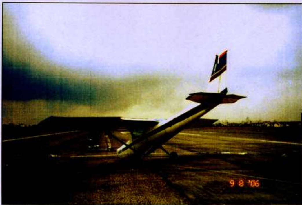
Fot. 10. Widok samolotu z boku z lewej strony