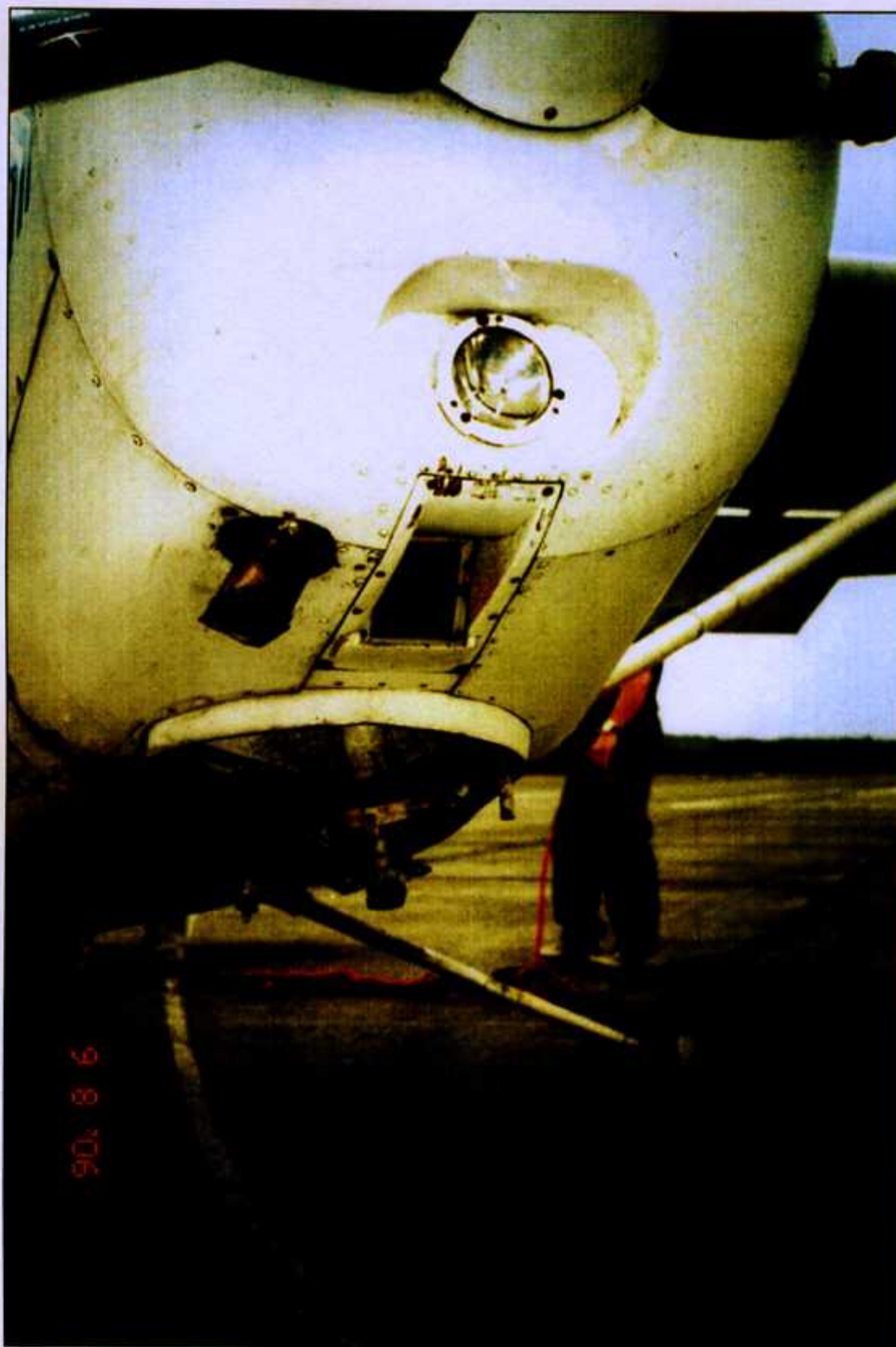
Fot. 12. Stan węzła mocowania goleni przedniej i rury wydechowej