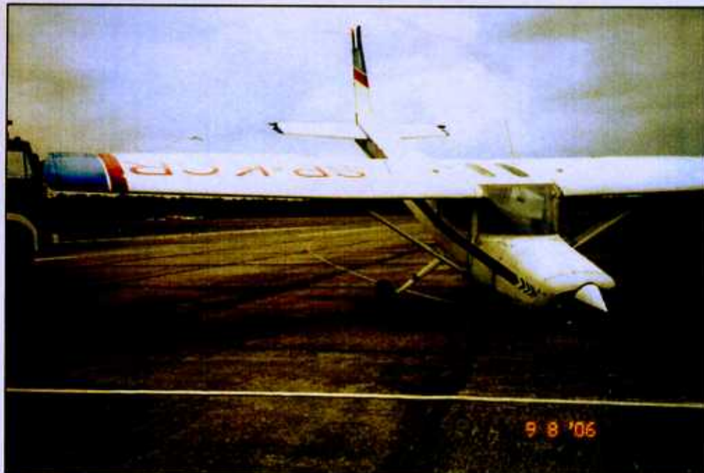
Fot. 9. Stan śmigła i osłony silnika