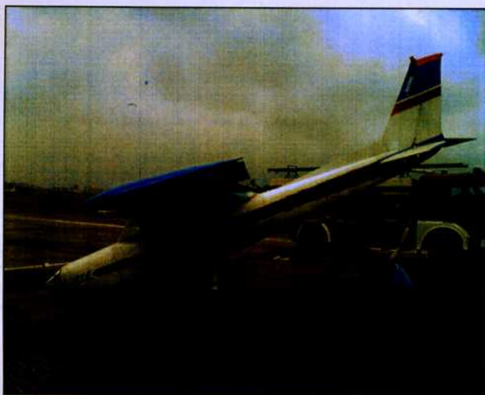
Fot. 5. Widok samolotu SP-KCR z boku