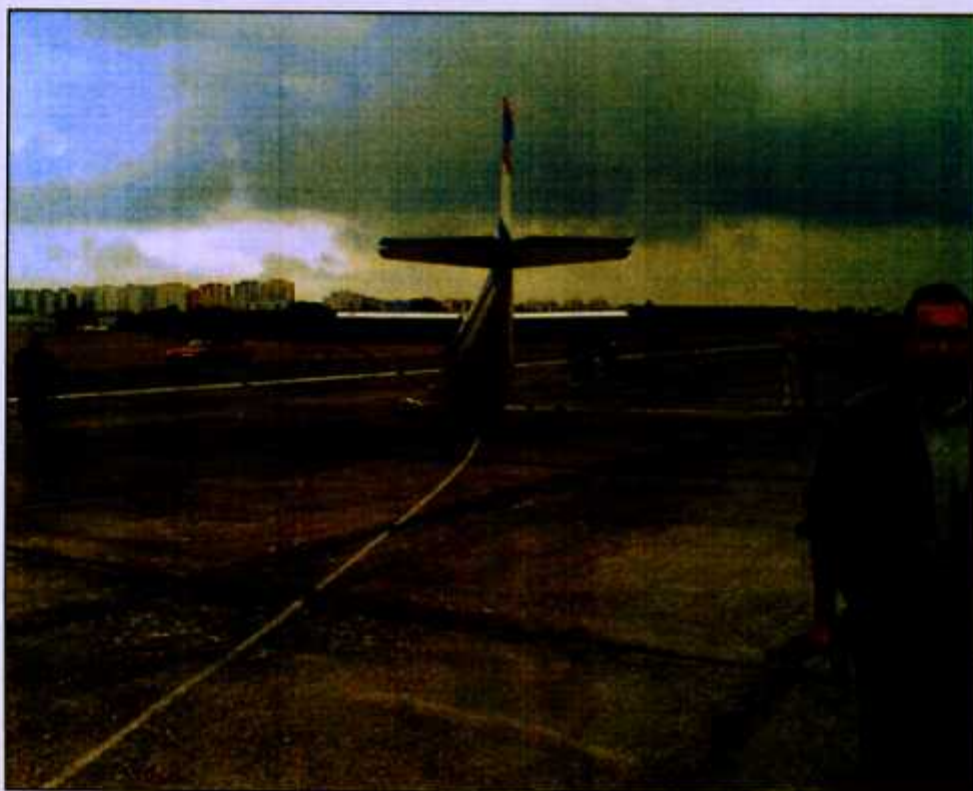
Fot. 4. Samolot, który uległ wypadkowi – widok z tyłu