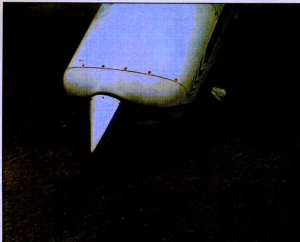
Fot. 7. Stan śmigła samolotu SP-KCR