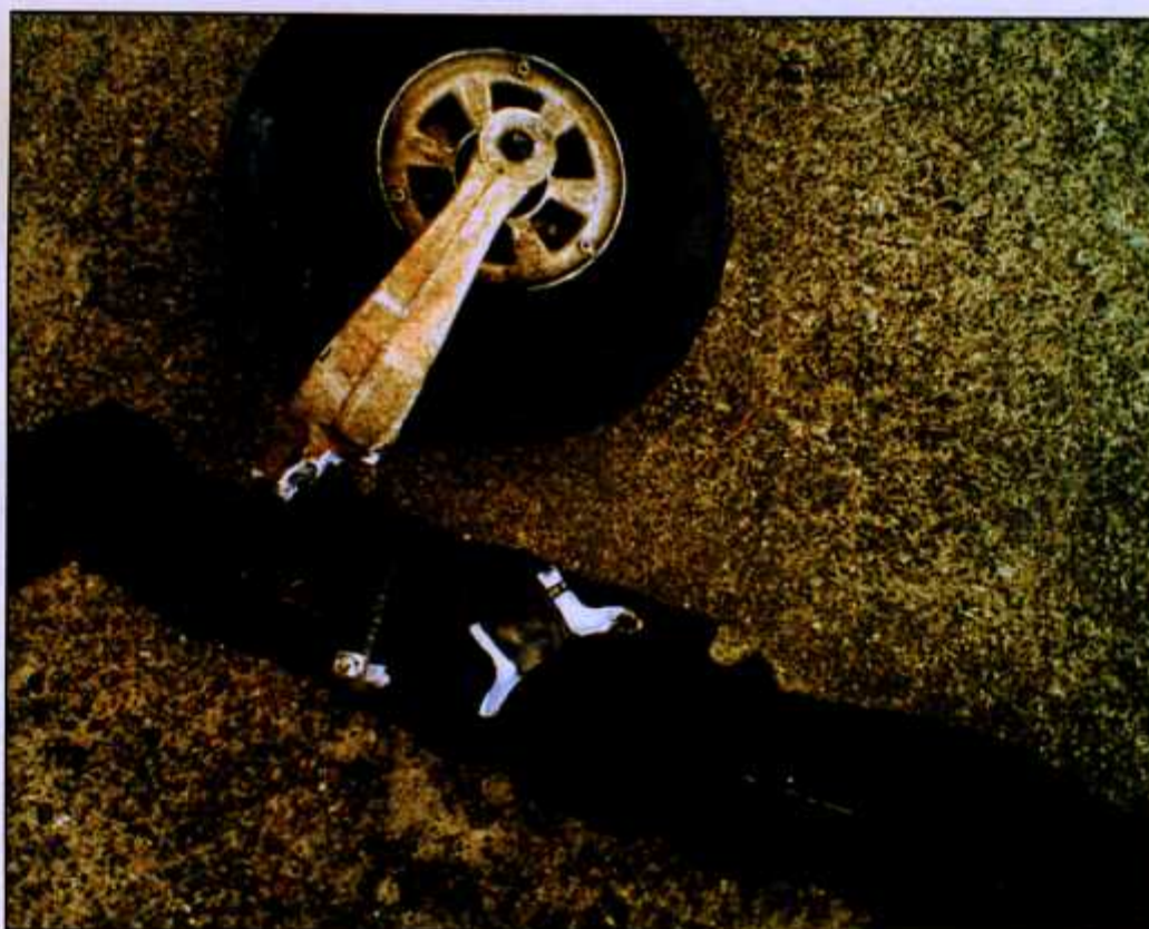
Rys. 14. Pęknięte gniazdo widelca przedniego koła