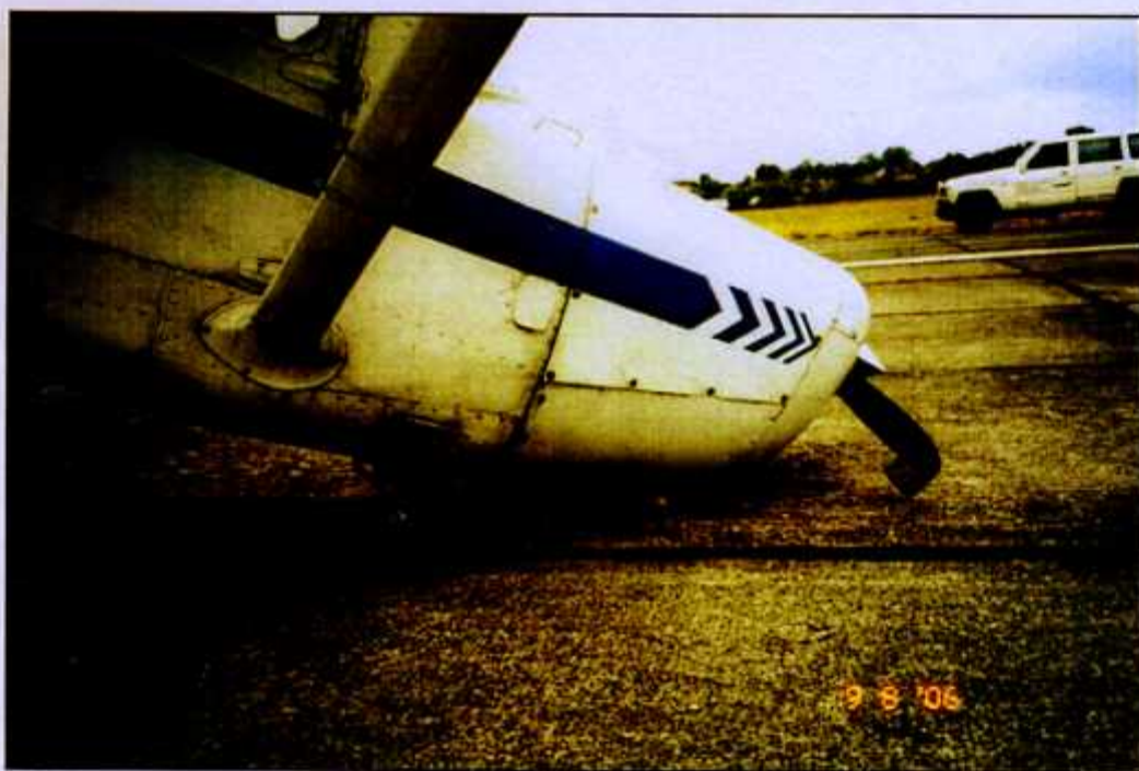
Fot. 11. Stan goleni przedniej i śmigła po wypadku