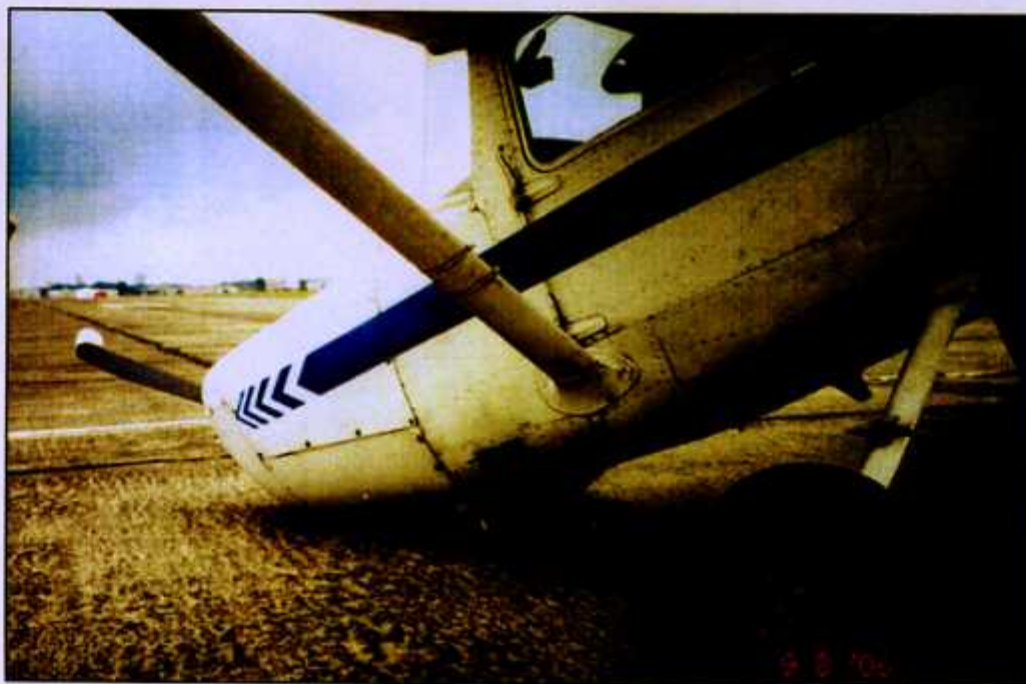
Fot. 13. Widok goleni przedniej z tyłu z lewej