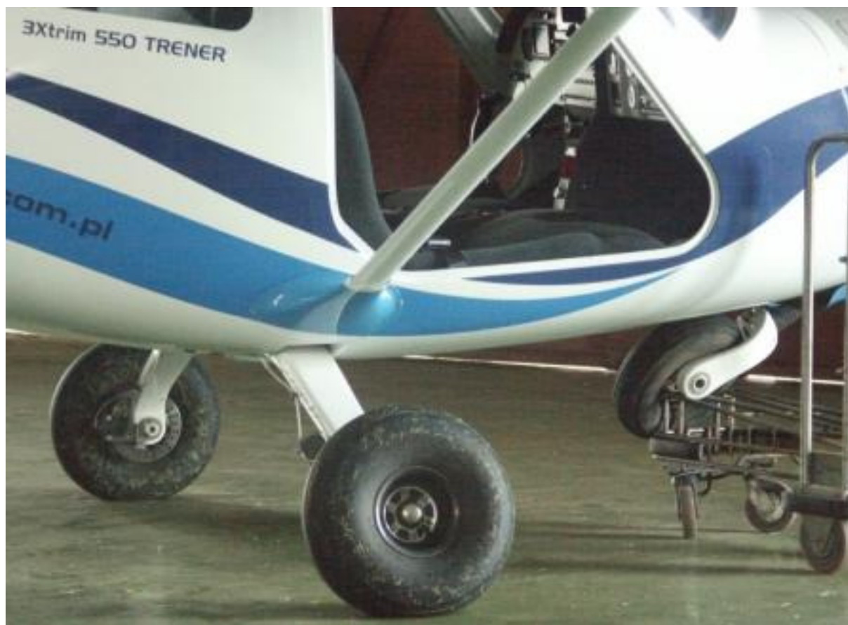
6 – Ogólny widok na uszkodzone podwozie samolotu z prawej strony