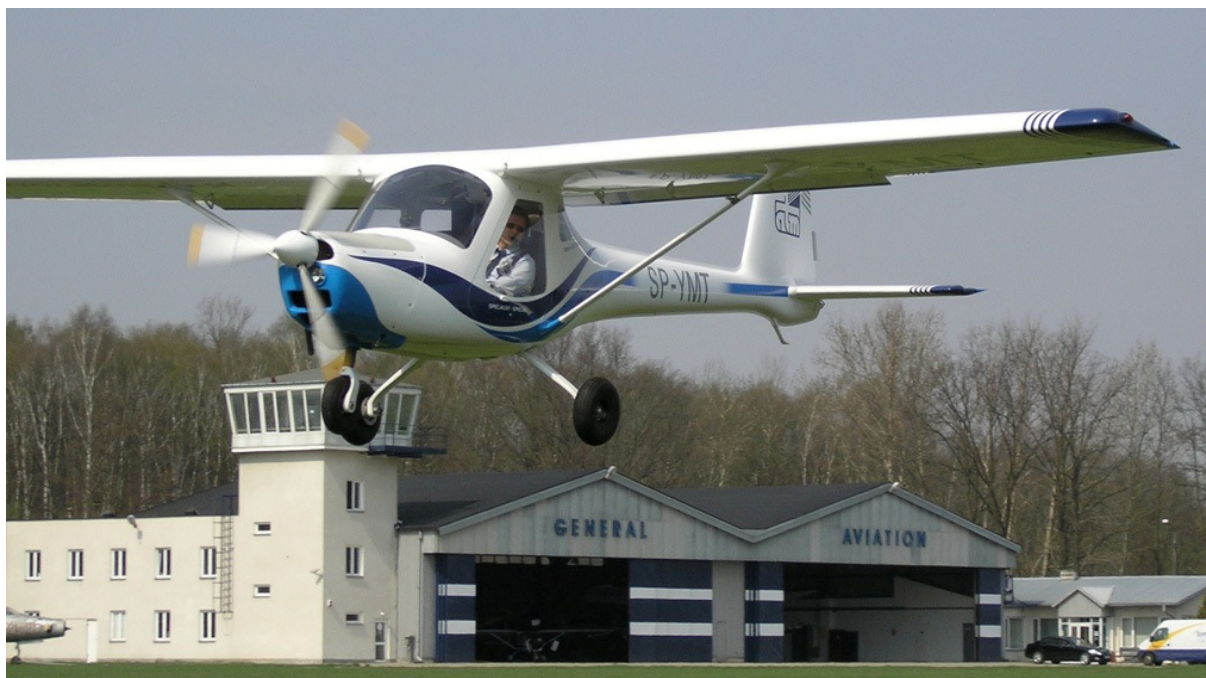
1 – Samolot 3Xtrim 550 Trener-Special-11 SP-YMT sfotografowany kilkanaście dni przed wypadkiem na lądowisku w Góraszce.