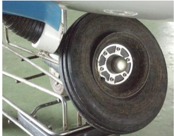
12, 13 – Złamane podwozie przednie pokazane od przodu (po lewej) i z lewej strony (prawe zdjęcie).