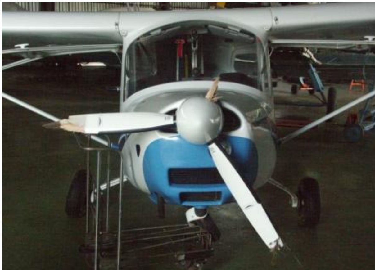
5 – Uszkodzony samolot od przodu.