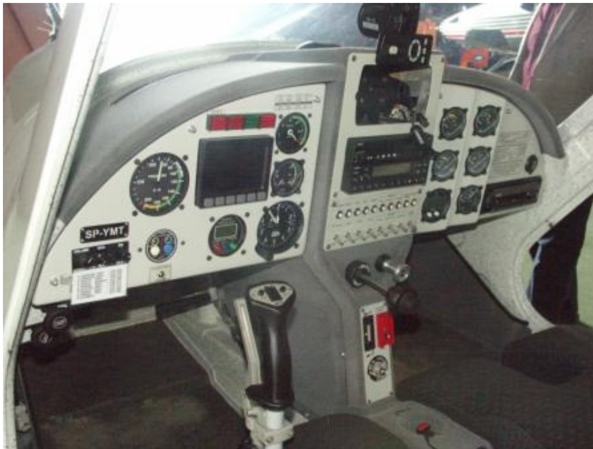
20 – Tablica przyrządów samolotu w hangarze po wypadku.