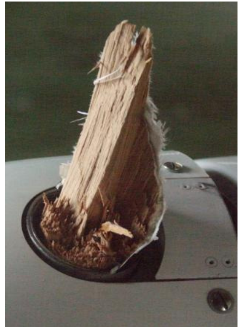
15 – Resztki łopaty śmigła w piasku.