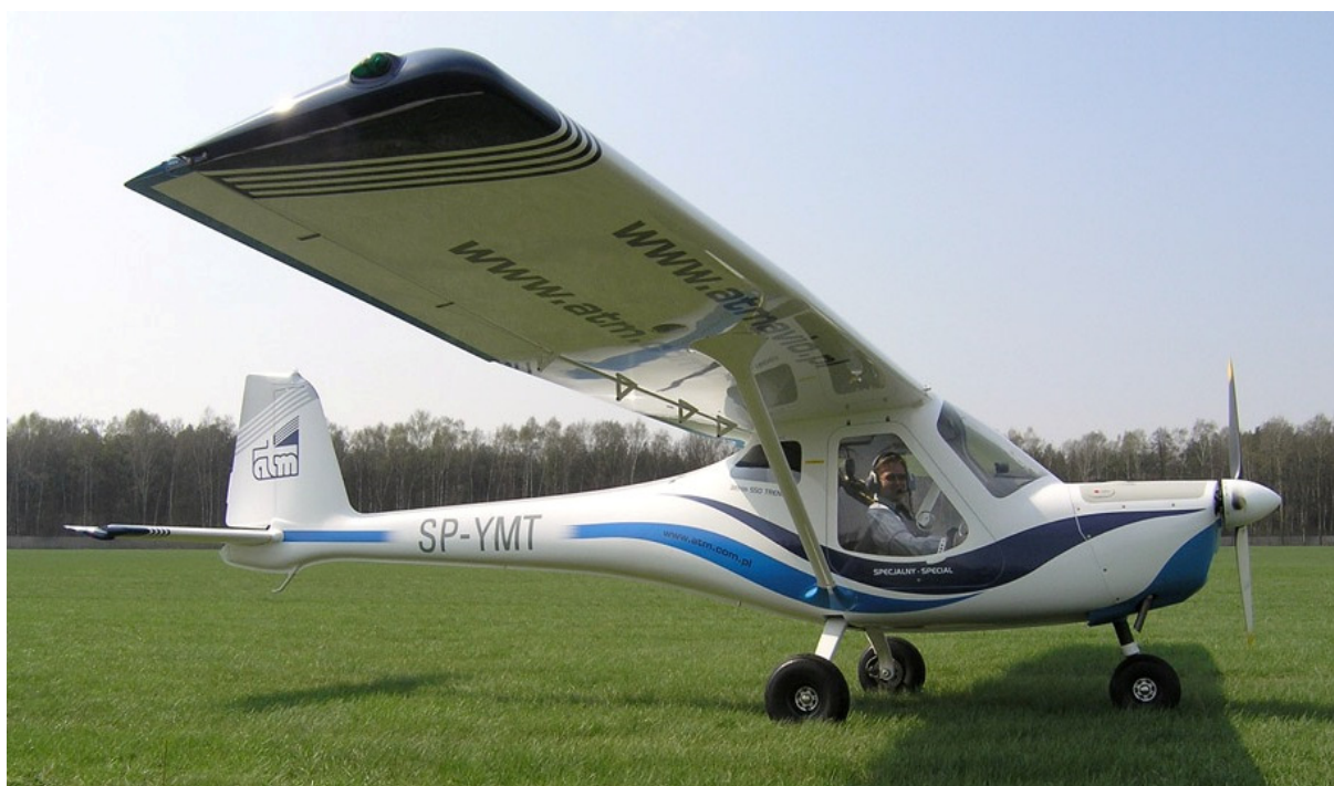
2 – Samolot 3Xtrim 550 Trener-Special-11 SP-YMT sfotografowany kilkanaście dni przed wypadkiem na lądowisku w Góraszce.