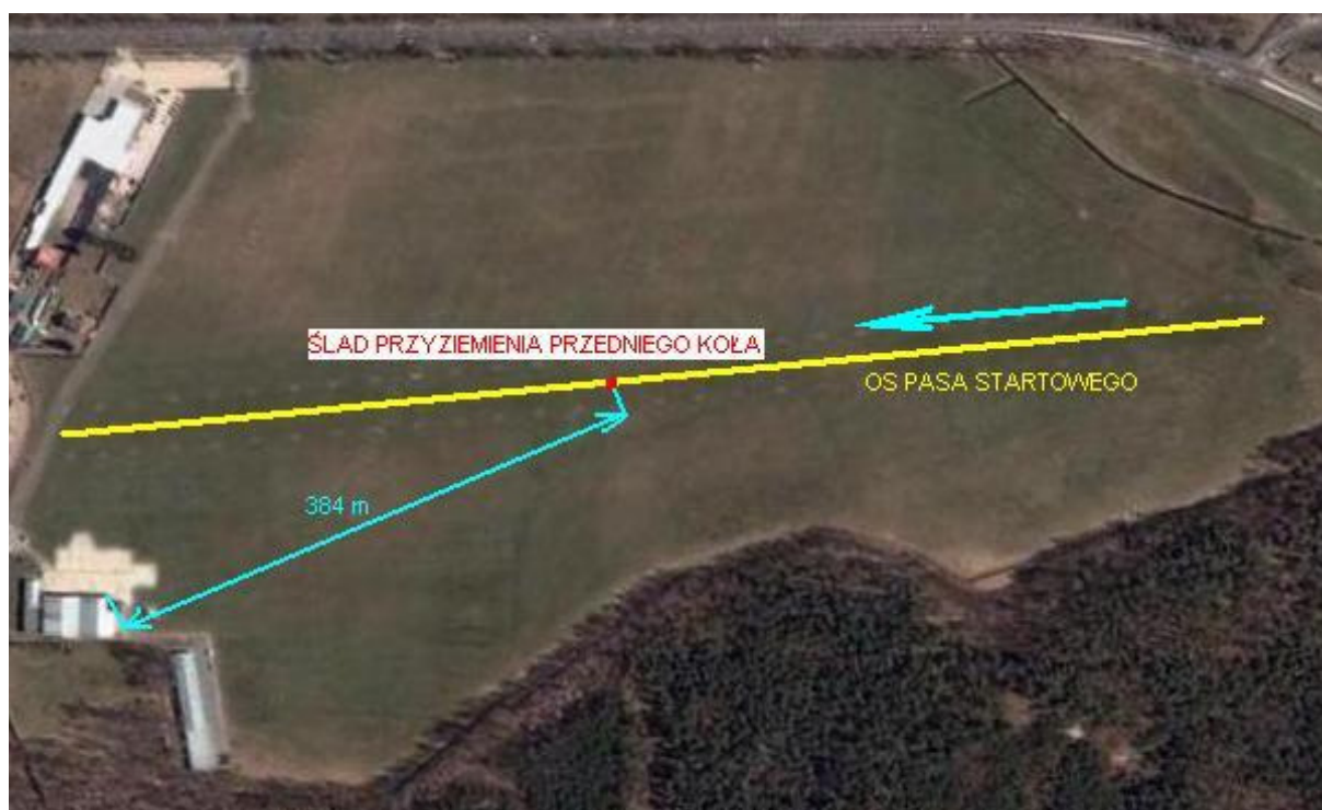
3 – Pas startowy lądowiska w Góraszce z zaznaczonym miejscem wypadku samolotu SP-YMT. Kierunek lądowania zaznaczony niebieską strzałką.