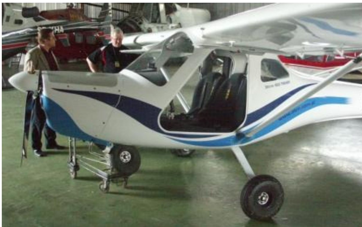
4 – Ogólny widok samolotu w hangarze po wypadku.