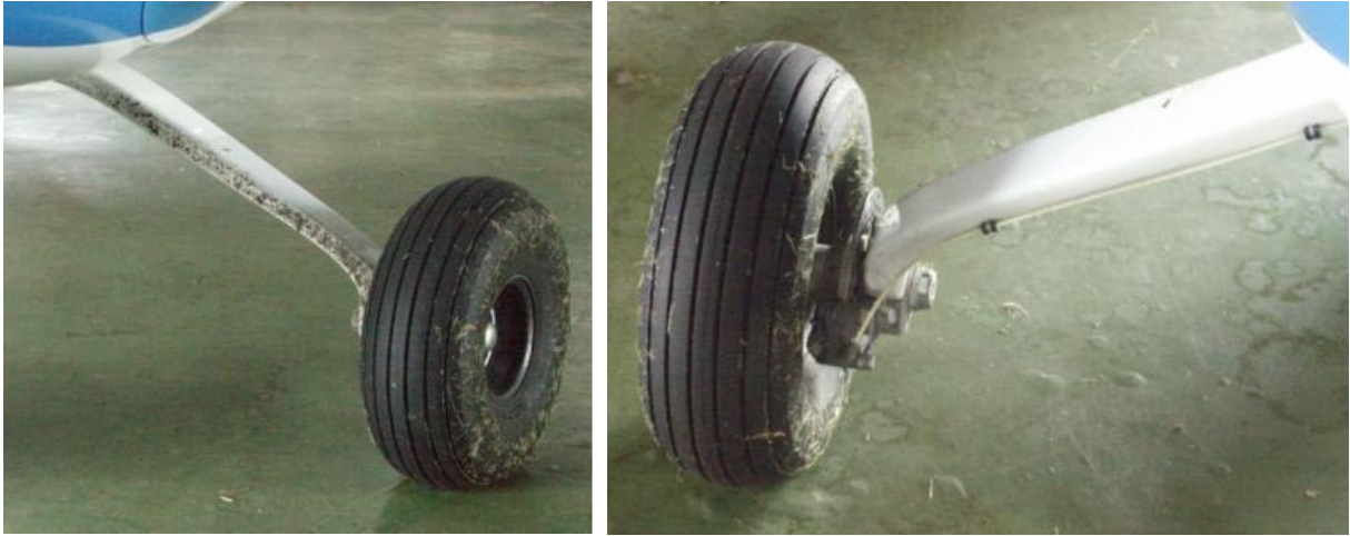
7, 8 – Lewe podwozie główne z przodu (po lewej) i z tyłu (po prawej) – brak widocznych uszkodzeń.