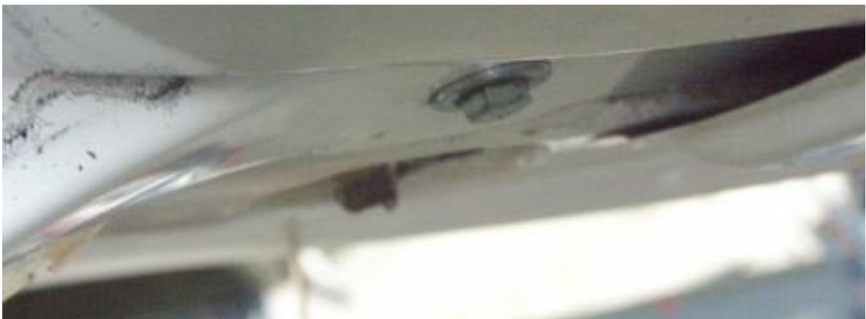
11 – Zamocowanie goleni prawego podwozia głównego do kadłuba, widziane od przodu. Po lewej stronie kadru widoczny szary ślad rozwarstwienia na goleni