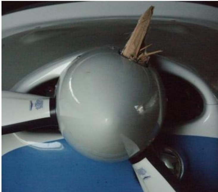
14 – Kołpak śmigła, widoczna wyłamana u nasady łopata.