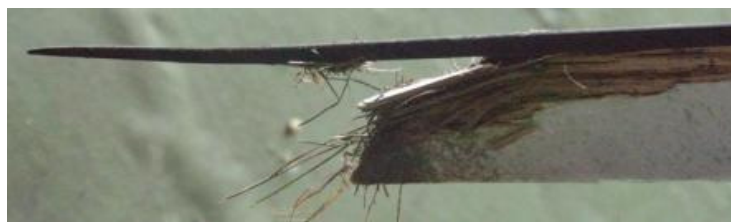
16, 17, 18, 19 – Końcowe fragmenty połamanych pozostałych łopat śmigła, pokazane od przodu (górne zdjęcia) i od tyłu (dolne zdjęcia)