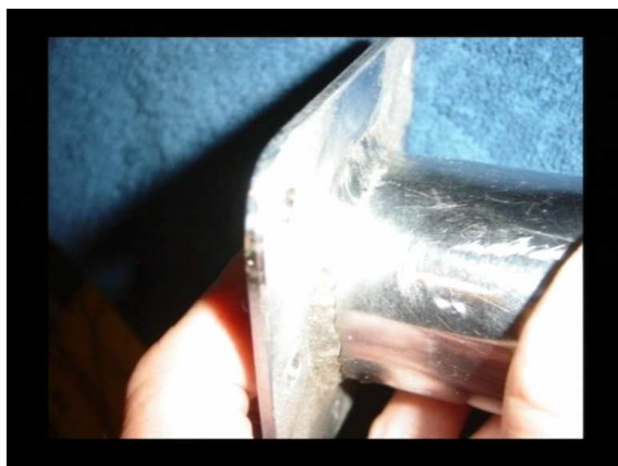
Rys. 9 Widok od strony, z której nie jest widoczne pęknięcie.