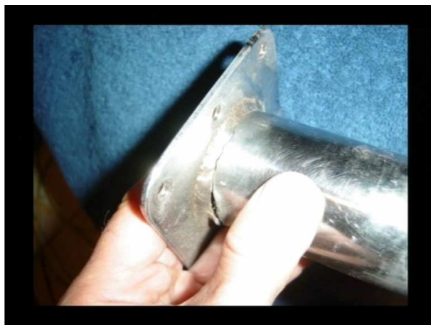
Rys. 7 Talerzyk przyłożony do goleni – widoczne pęknięcie