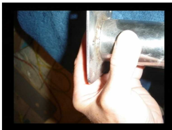
Rys. 6 Talerzyk przyłożony do nogi – nie widoczne pęknięcie