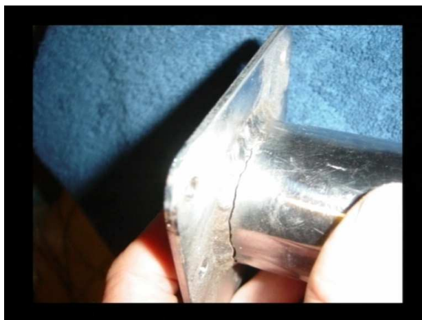
Rys. 8 Talerzyk przyłożony do goleni – widoczne pęknięcie