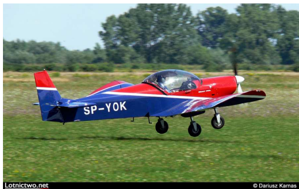
Rys.1 Samolot ZODIAK CH601HD SP-YOK