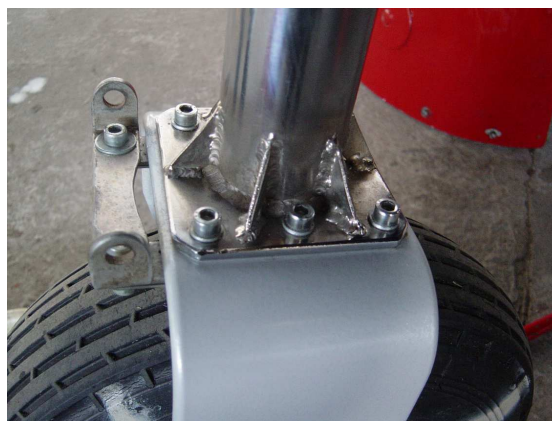
Rys. 10 Zmienione rozwiązanie konstrukcyjne połączenia talerzyka z rurą goleni (widoczne elementy zapobiegające nadmiernemu odkształcaniu się talerzyka.