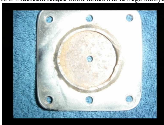
Rys.4 Talerzyk mocowania widelca koła.