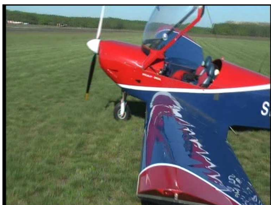
Rys. 3 Widok na samolot wzdłuż skrzydła z kierunku wschodniego.