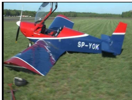
Rys. 2 Widok na samolot na miejscu wypadku (widoczne koło z widelcem leżące obok końcówki lewego skrzydła)