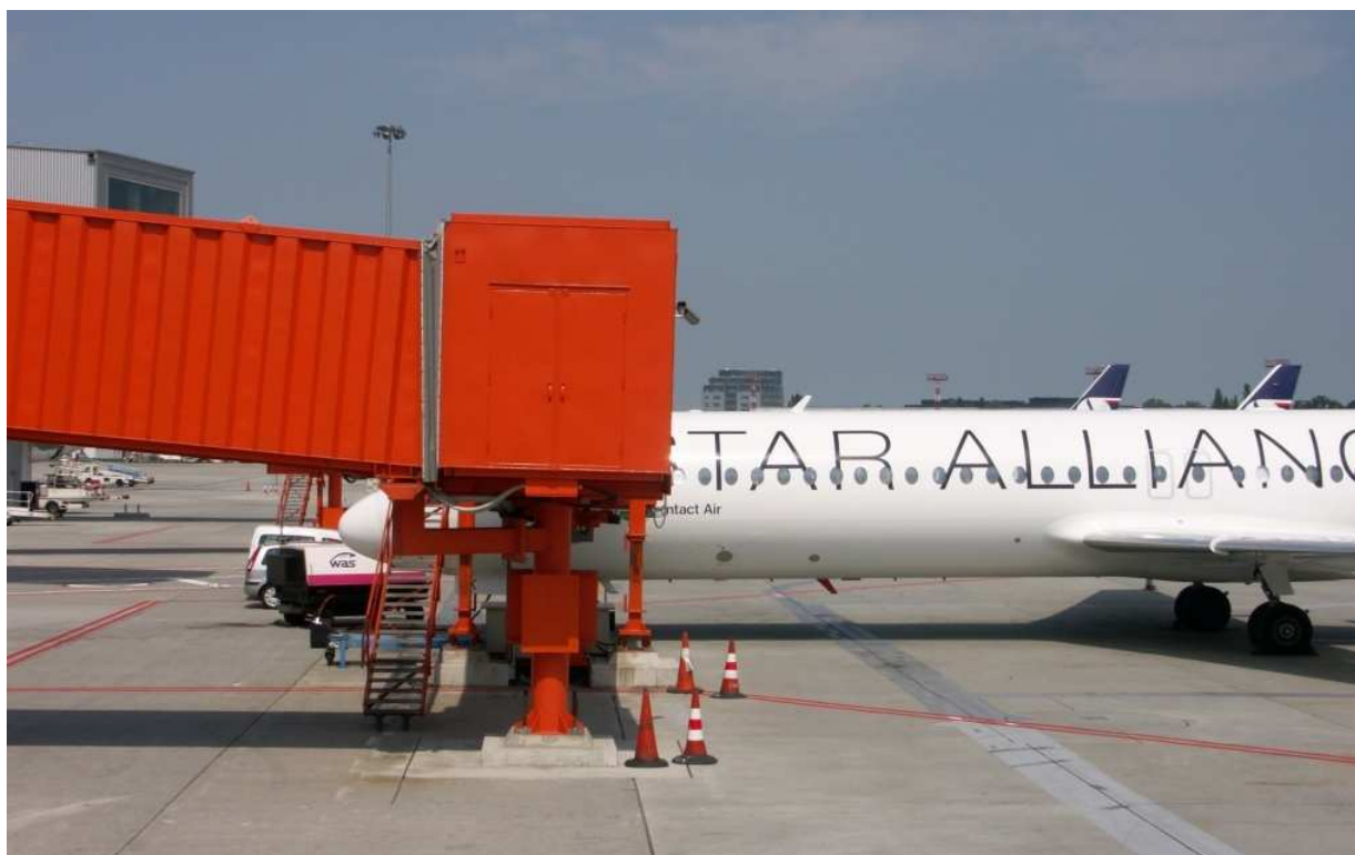
1 – Ogólny widok sytuacji – samolot Fokker F-100 D-AGPK przy rękawie STD4.