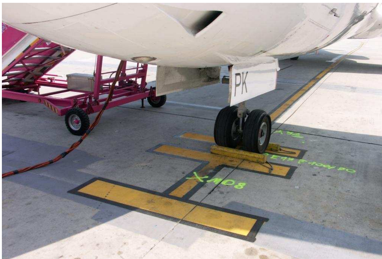
2 – Zaznaczenie położenia samolotu na płycie.