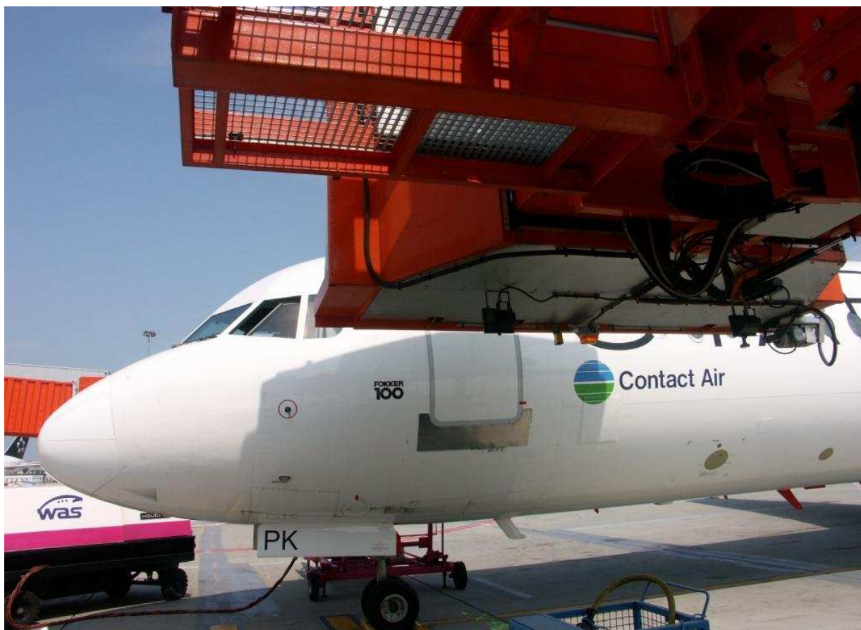
5 – Dolna część pomostu rękawa i lewa burta samolotu.