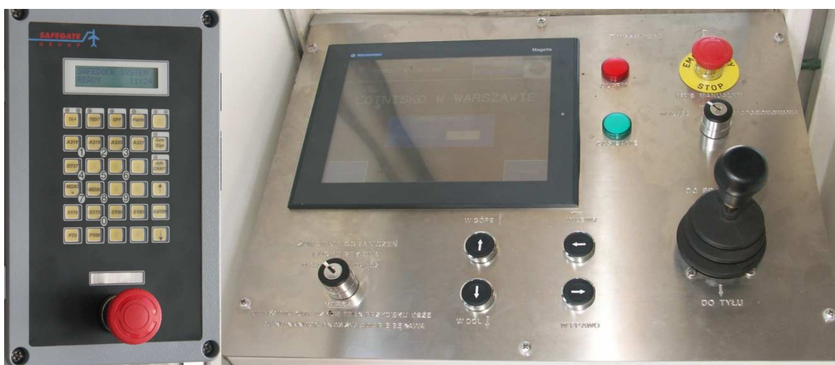
12 i 13 – Pulpity sterowania rękawem - lewy (po lewej) i główny (po prawej).