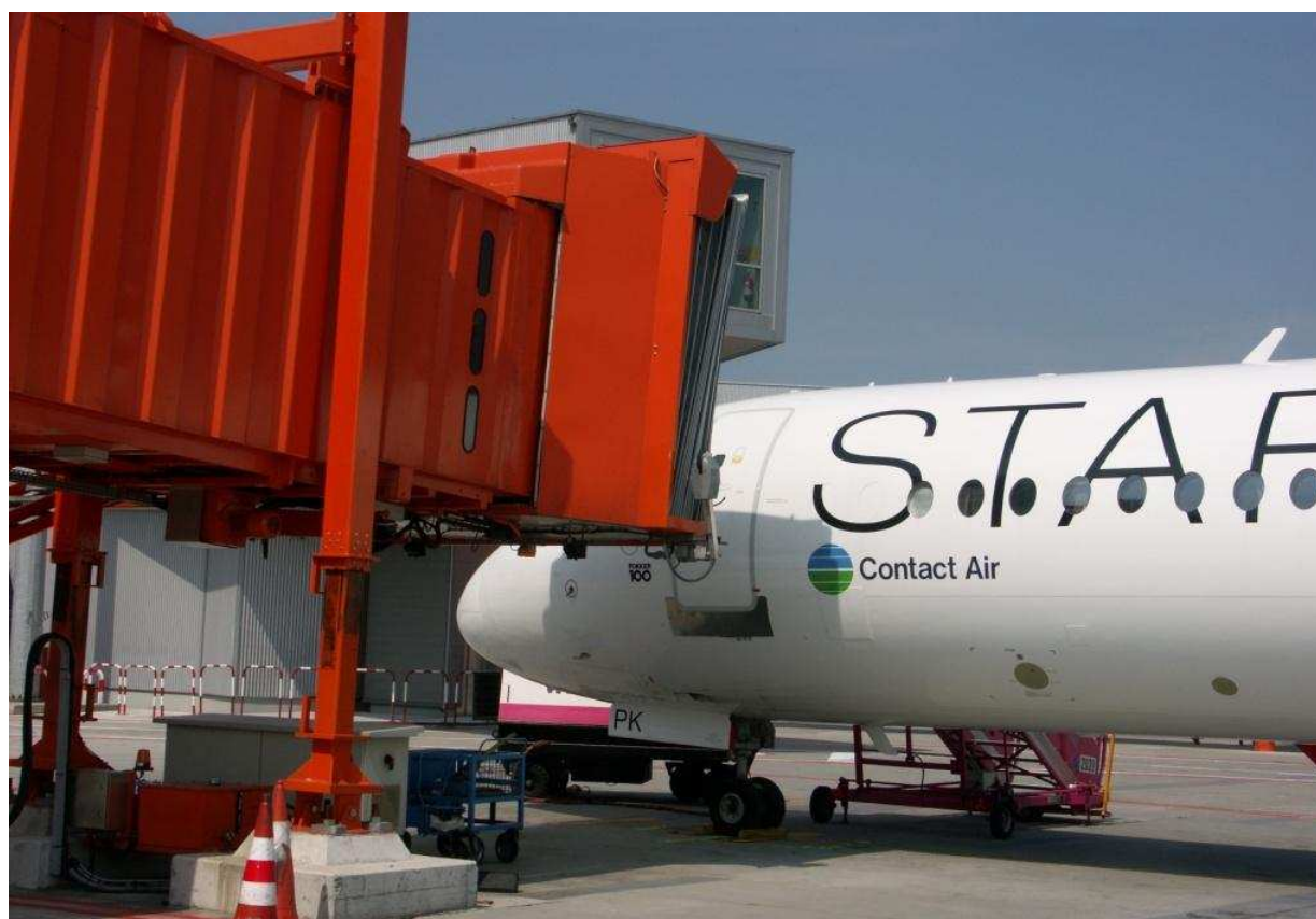
4 – Widok na lewą burzę samolotu i rękaw \frac{3}{4} od tyłu.