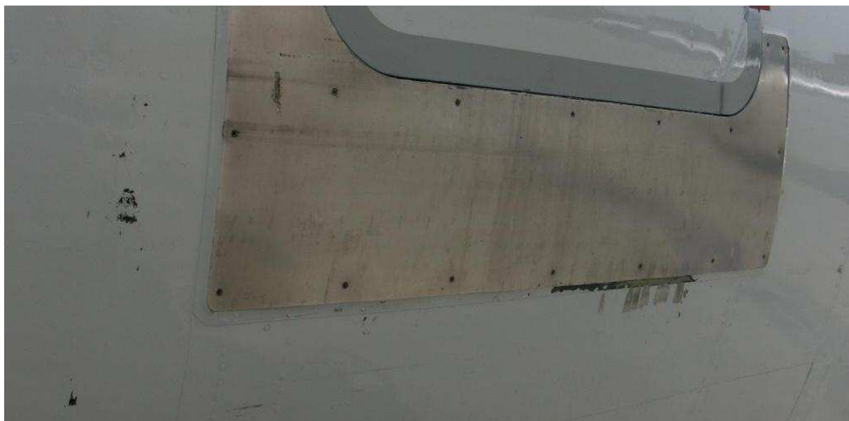
7 i 8 – Uszkodzenia lakieru na lewej burcie samolotu przy dolnej krawędzi drzwi pasażerskich.