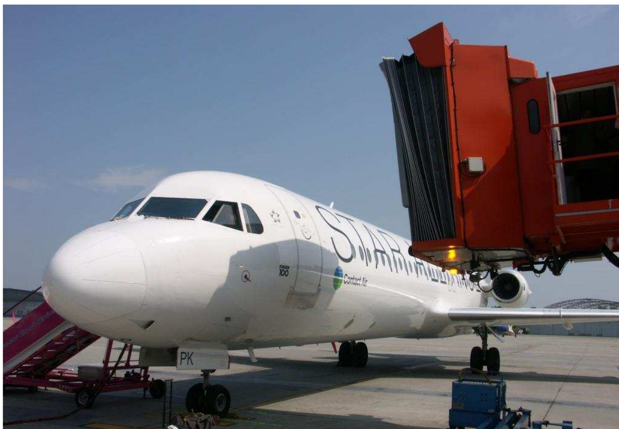
3 – Widok na lewą burzę samolotu i rękaw \frac{3}{4} od przodu.