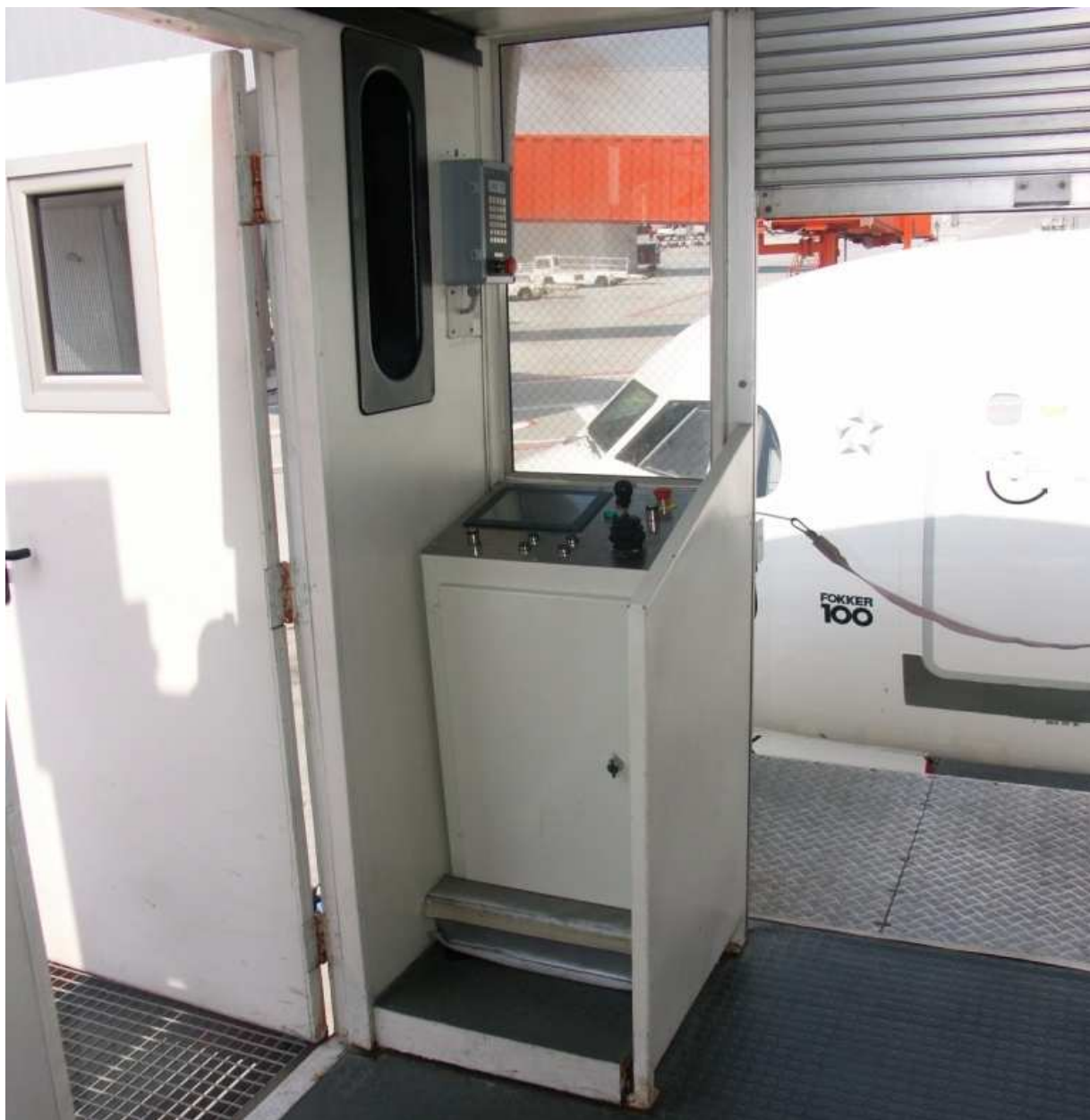
11 – Stanowisko sterowania rękawem.