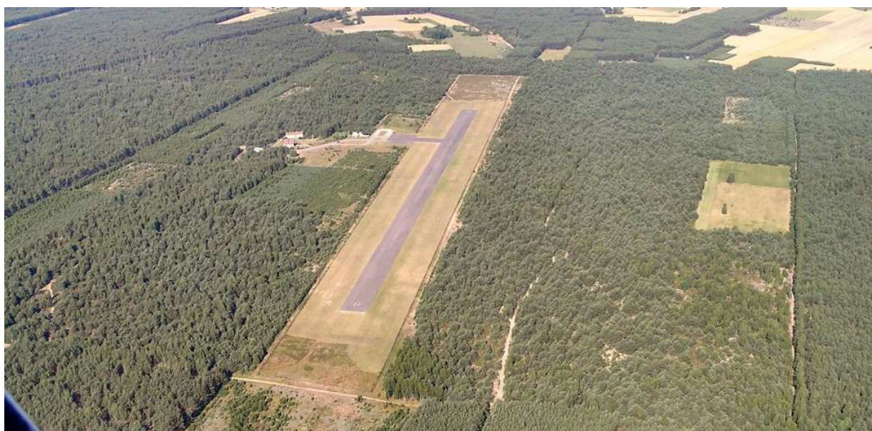
2 – Lądowisko Grądy (EPGY) z drogą startową 09-27 o nawierzchni asfaltowej o wymiarach 804 x 24,4 m.