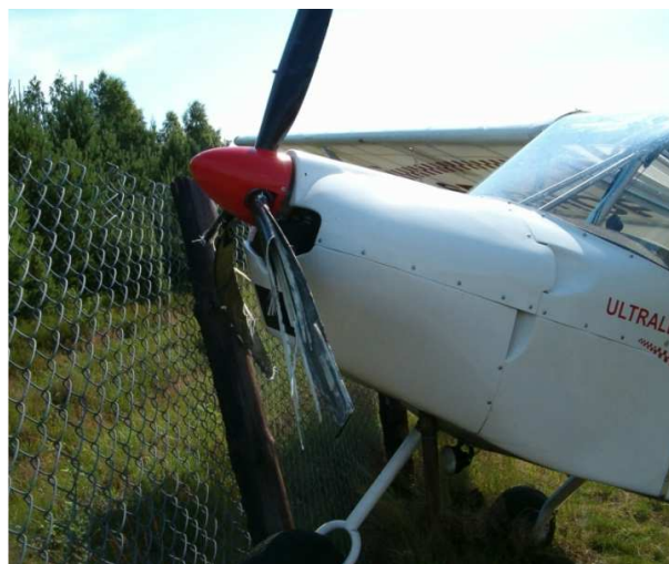
4 i 5 – Samolot po zderzeniu z ogrodzeniem lądowiska (metalowa siatka na drewnianych słupkach). Dobrze widoczne zniszczone łopaty śmigła.