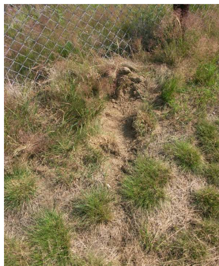
13 i 14 – Dorze widoczne ślady miejsca wypadku (zderzenia samolotu z ogrodzeniem lądowiska) powstałe od koła samolotu.