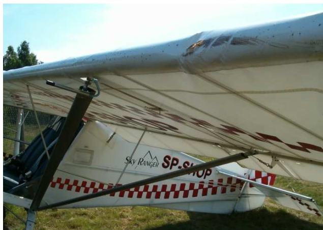
8 – Dobrze widoczna uszkodzona krawędź natarcia lewego skrzydła.