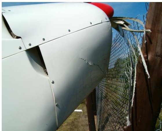
7 – Zniszczone łopaty śmigła i uszkodzona dolna osłona silnika.