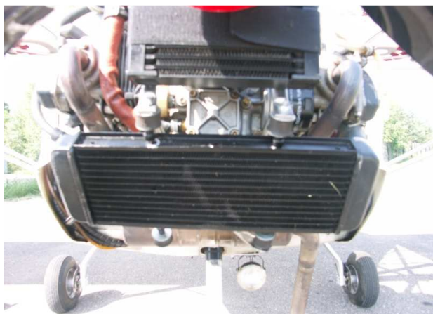
9 – Widoczna wybudowana chłodnica samolotu po zdjęciu osłon silnika.