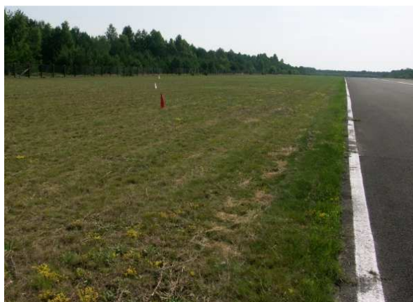
11 i 12 – Kierunek dobiegu samolotu (oznaczony chorągiewkami) na części trawiastej lądowiska na długości ok. 90 m. Z prawej widok w kierunku dobiegu, z lewej – w kierunku przeciwnym. Dobrze widoczna droga startowa 09-27 o nawierzchni asfaltowej oraz ogrodzenie lądowiska.