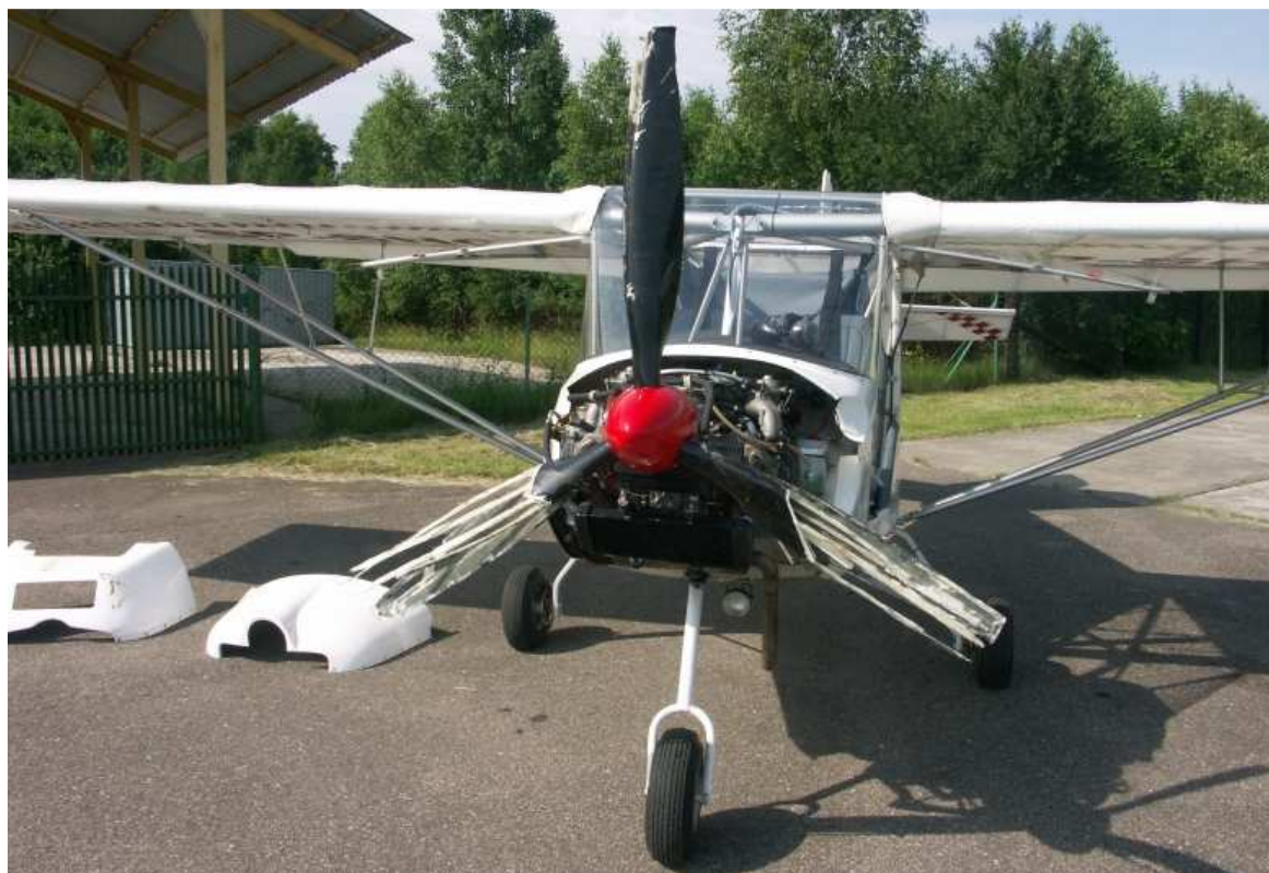
6 – Samolot na płycie postojowej przed hangarem na lądowisku Grądy (EPGY). Dobrze widoczne zniszczone łopaty śmigła.