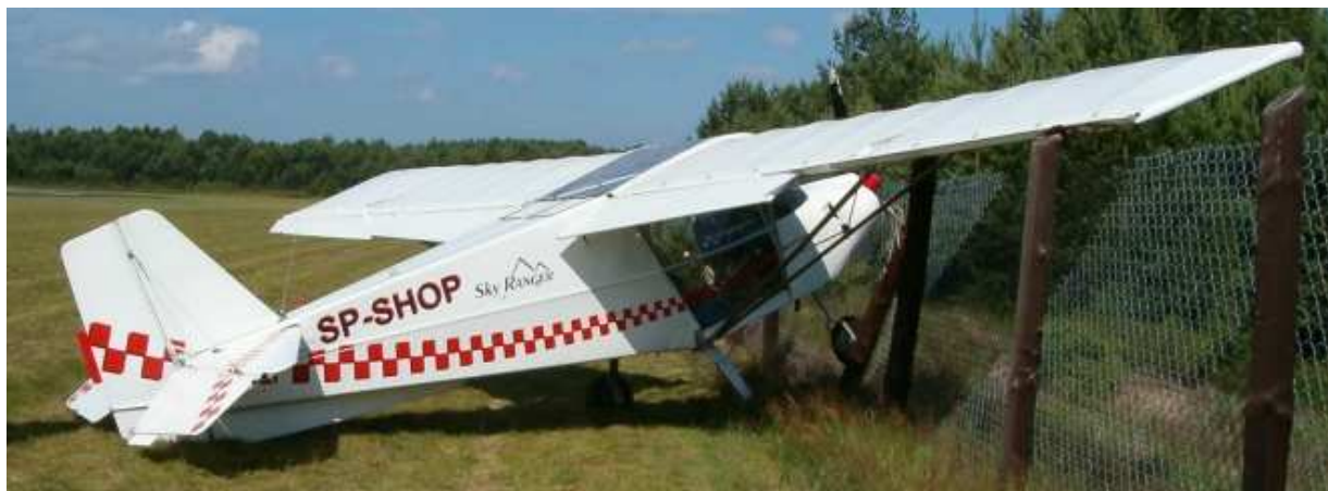
1 – Samolot Sky Ranger kategorii UL z silnikiem Rotax 912 UL, znaki SP-SHOP, sfotografowany po wypadku na lądowisku Grądy (EPGY).