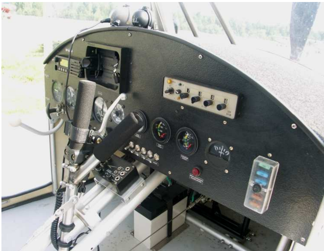
15 – Tablica przyrządów samolotu Sky Ranger SP-SHOP – widok ogólny.