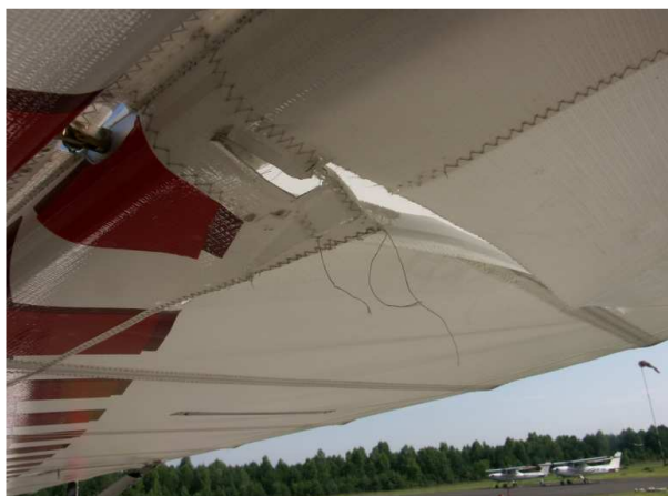
10 – Widoczne uszkodzenia płóciennego poszycia samolotu.