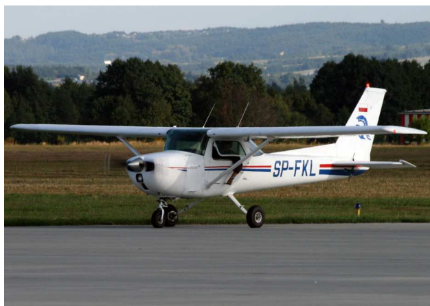
Rys.1 Samolot Cessna 150M, SP-FKL w innym malowaniu