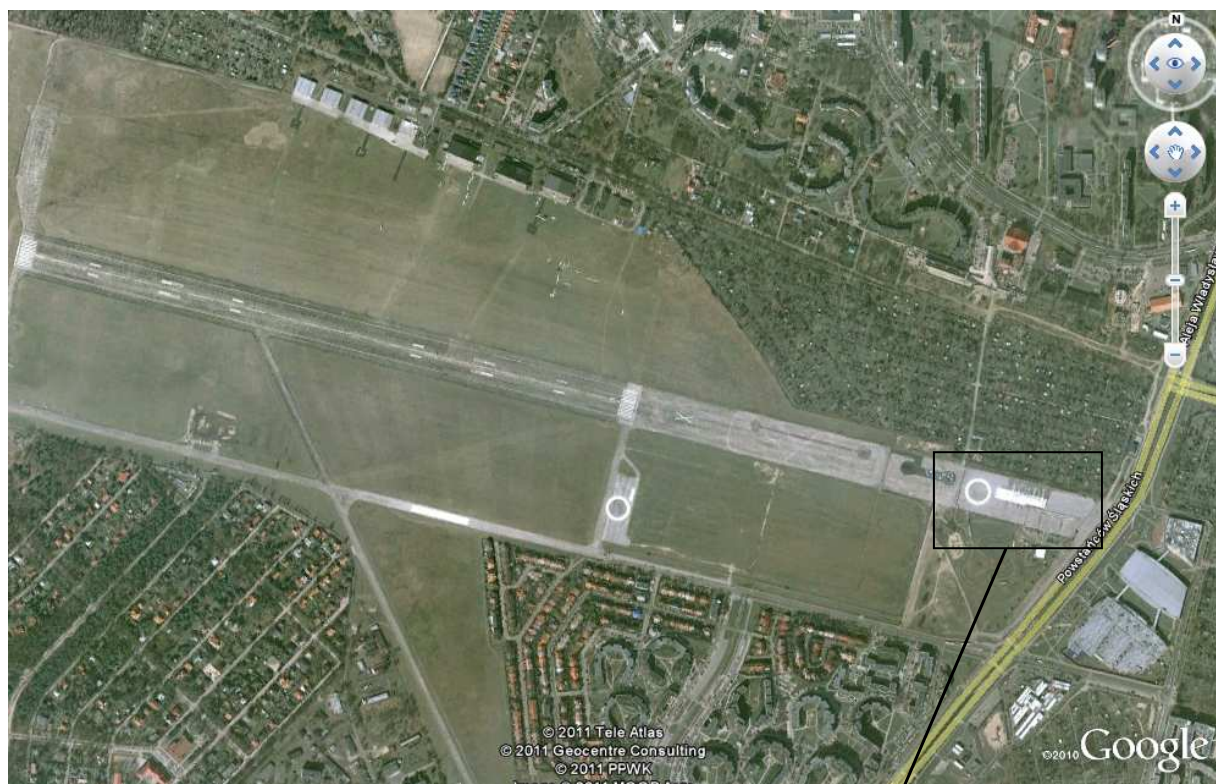
Lotnisko Warszawa Babice