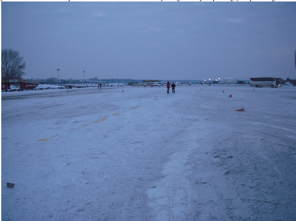
Rys.5 Widoczne miejsce przyziemienia a w oddali samolot na miejscu zdarzenia.