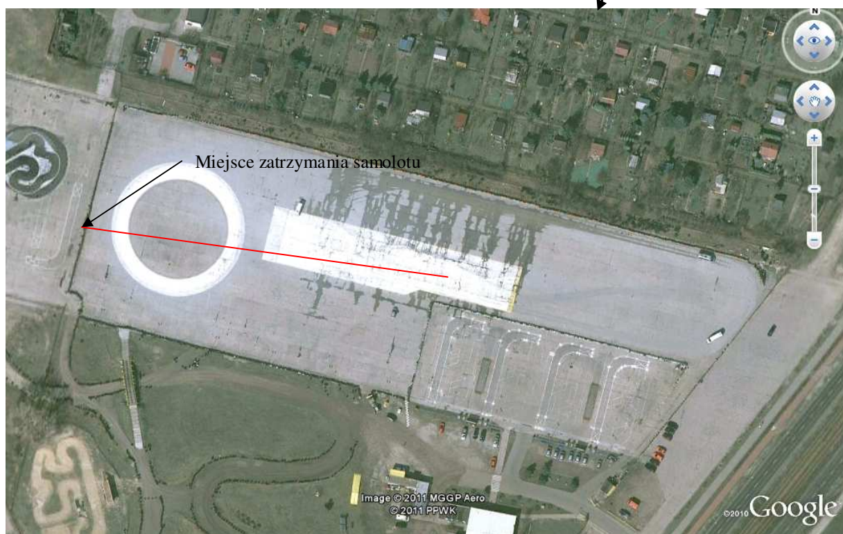
Szkic sytuacyjny miejsca zdarzenia. Czerwoną linią zaznaczony ślad dobiegu o długości ok. 180 m.