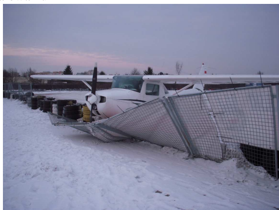
Rys. 3 Widok na samolot z przodu.