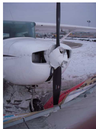
Rys.4 Zgnieciony kołpak i zgięta łopata śmigła.