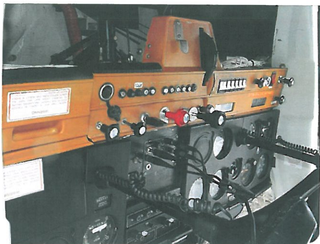
Rys.5 Widok na tablicę przyrządów.