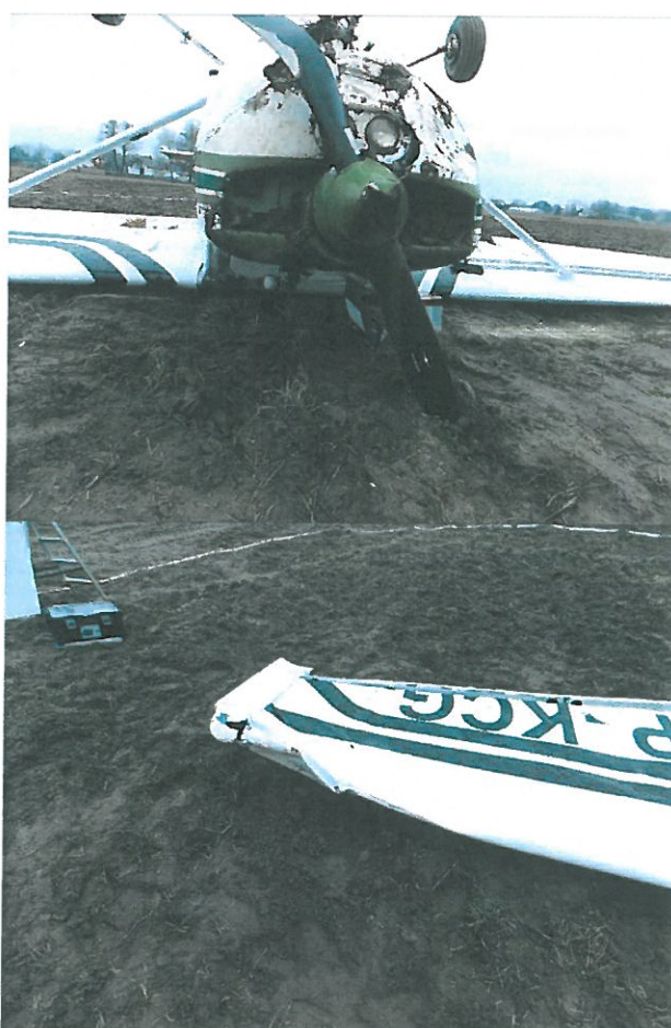
Rys. 4 Zbliżenia na uszkodzone elementy samolotu.