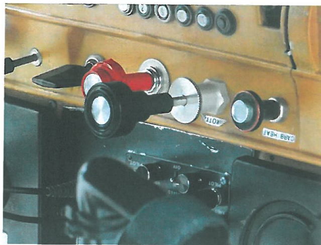
Rys. 6 Zbliżenie na gałki sterowania silnikiem.