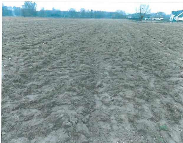
Rys. 3 Ślady kół samolotu po przyziemieniu.