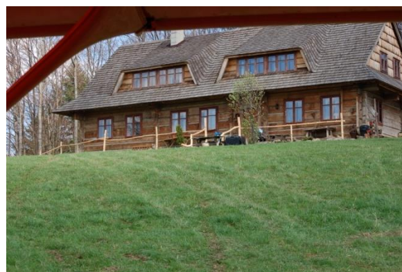
Rys. 2. Dwa zdjęcia obrazujące pochyłość stoku na miejscu zdarzenia.