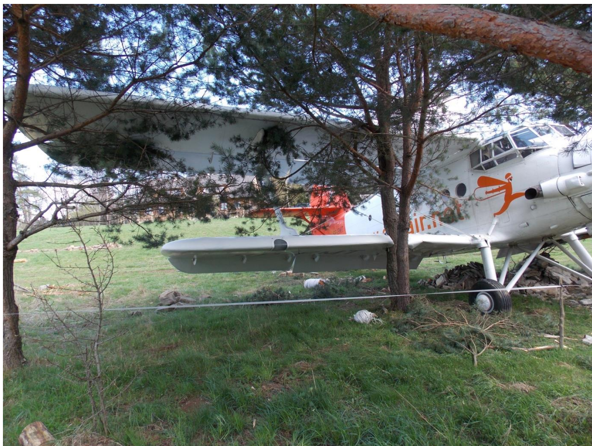
Rys. 5. Uszkodzenia prawych skrzydeł.