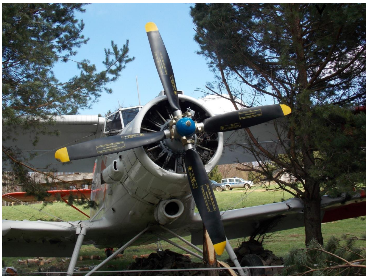
Rys. 4. Widok samolotu od czola. Na pierwszym planie uszkodzone śmigło.