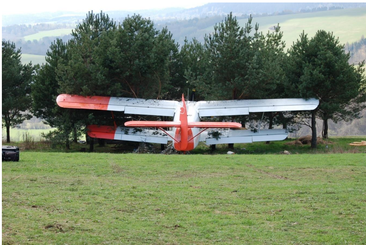
Rys.1. Samolot AN-2P, SP-FMT na miejscu wypadku.