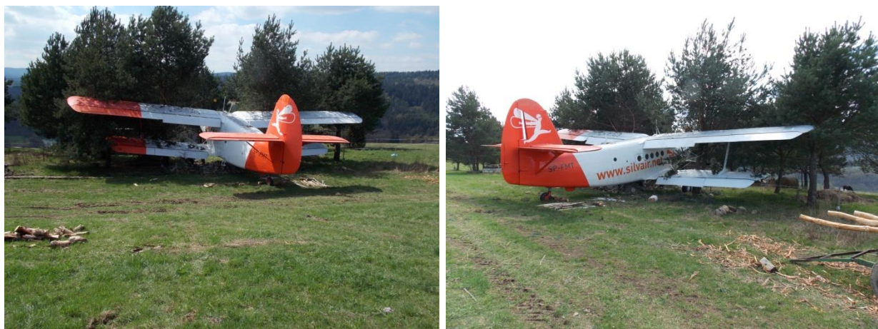
Rys. 3. Samolot na miejscu wypadku – widok z lewej i prawej strony.