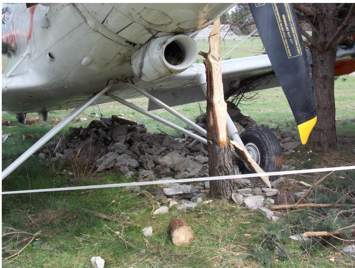
Rys.8. Pień młodej sosny ścięty śmigłem.