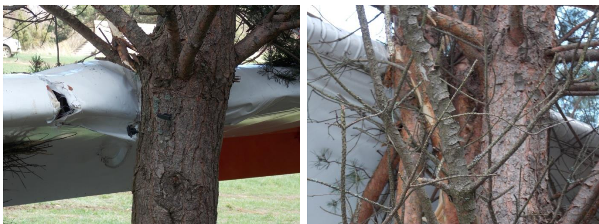
Rys. 7. Szczegóły uszkodzeń lewych skrzydeł.