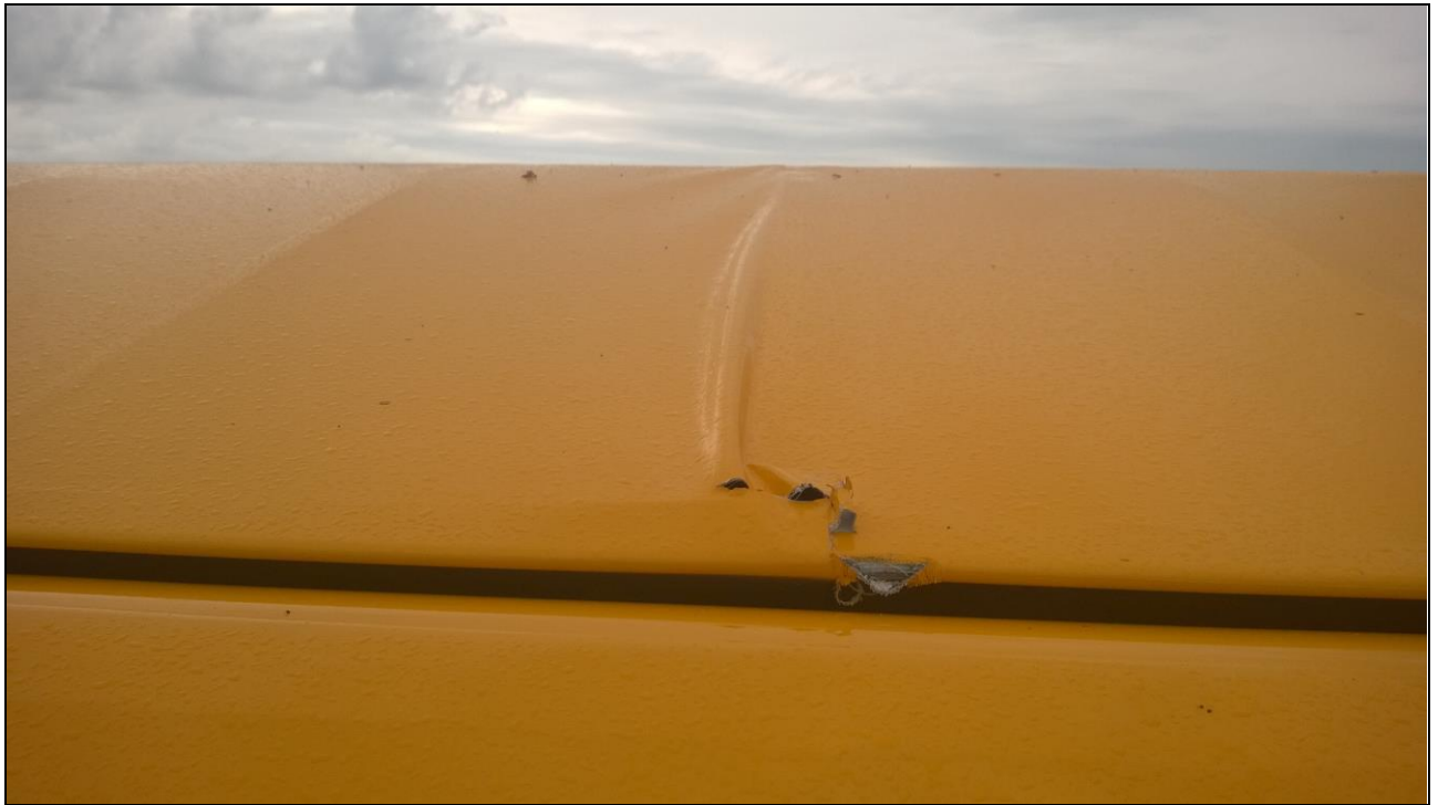
5 – Spływowa część lewego skrzydła przy szczelinie klapolotki – widoczne uszkodzenia.