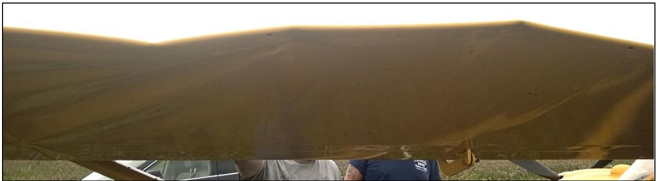
6 – Połamana lewa klapolotka.