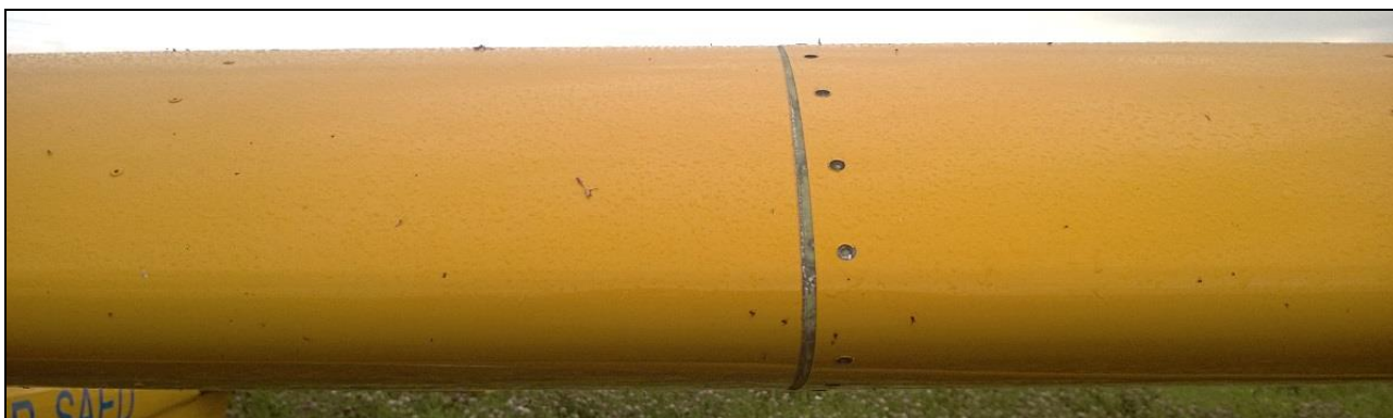
4 – Ścięty szew nitowy na połączeniu arkuszy blach pokrycia noska.