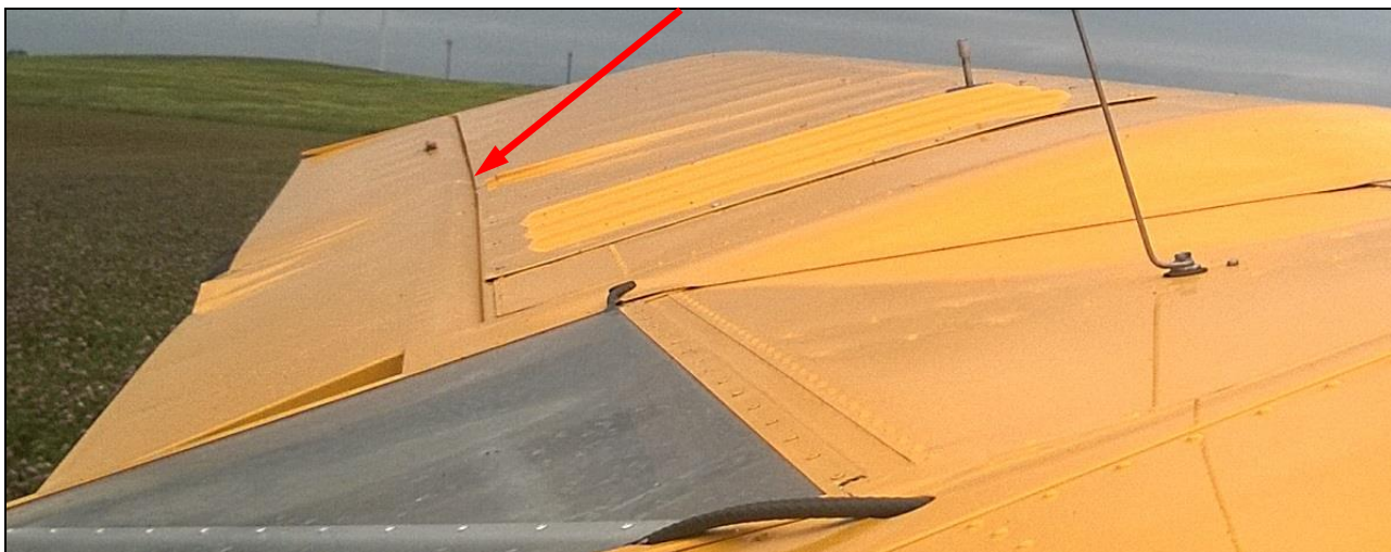
3 – Widok na górną powierzchnię lewego skrzydła. Zwraca uwagę widoczne załamanie szczeliny klapolotki.