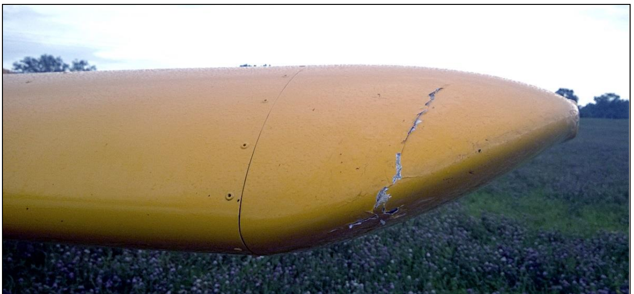
7 – Końcówka lewego skrzydła od przodu – widoczne pęknięcie po kolizji z niezidentyfikowanym obiektem.