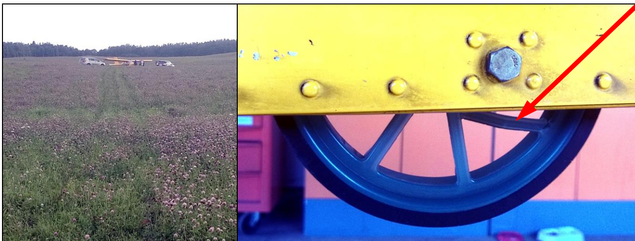
1, 2 – Miejsce lądowania z widocznym śladem i uszkodzone kółko ogonowe.

przekazywanych przez niego opisów znajdującego się pod nim terenu, nie można było ustalić jego pozycji. Po około 2 godzinach lotu i analizie ilości pozostałego na pokładzie paliwa, instruktor nadzorujący podjął decyzję i polecił uczniowi pilotowi wykonanie lądowania zapobiegawczego w terenie przygodnym. Uczeń pilot po lądowaniu ok. godz. 11:45 LMT na polu w miejscowości Wydminy k/Giżycka przez radio poinformował o miejscu lądowania, o braku obrażeń i o uszkodzeniach samolotu. W rozmowie telefonicznej uczeń pilot poinformował, że w trakcie lotu na wysokości 2000 stóp nad Bartoszczami doszło do zderzenia z nierozpoznanym obiektem, co spowodowało uszkodzenia lewego skrzydła samolotu.